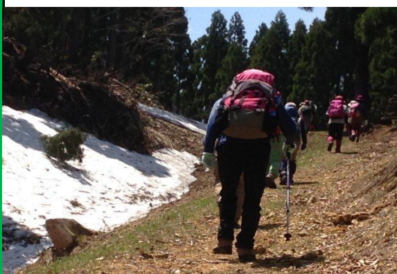
山頂付近にはまだ雪が残っています