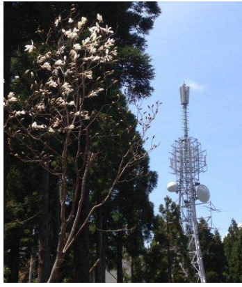
コブシと山頂の鉄塔