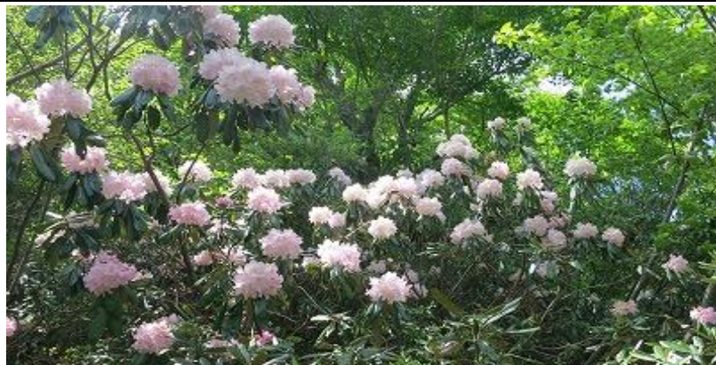
シャクナゲがまさに見頃です