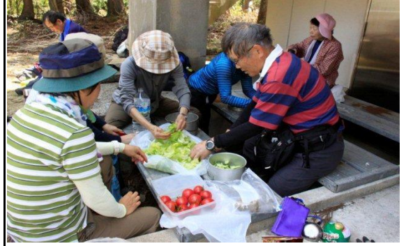
山頂ではサラダが振る舞われました