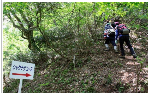
シャクナゲコースは急登が続きます