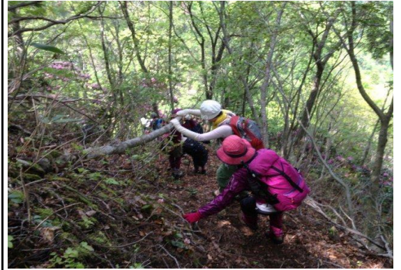
シャクナゲには申し訳ないですが枝にぶら下がりながらの下山