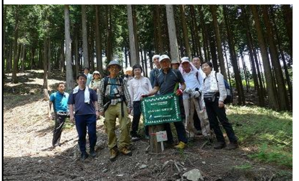
峠に下山してきました