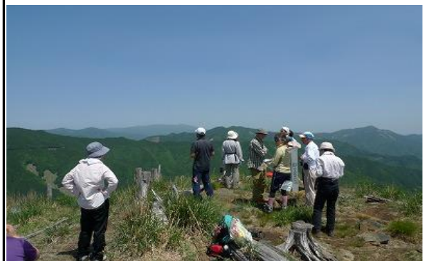
しばし兵庫の山々のパノラマを楽しむ