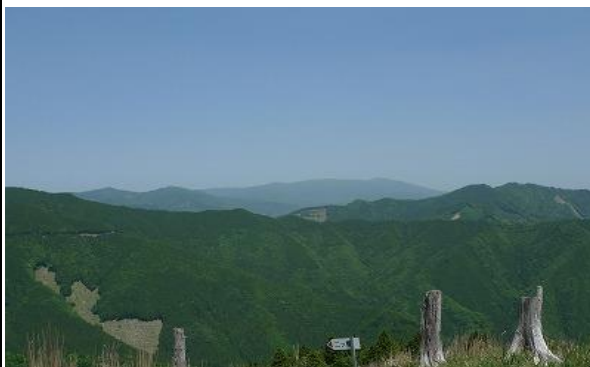
山頂からの展望、中央奥が氷ノ山です