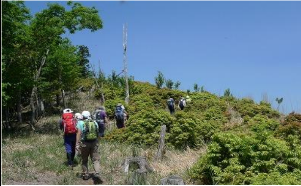
展望が開ける、山頂まであとわずか