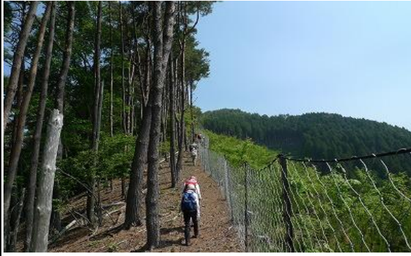
登り出しは、獸除けネット沿い