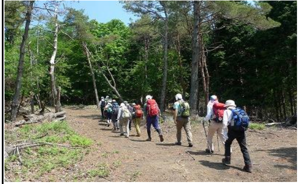
この付近一帯は伐採され工事が進んでいる