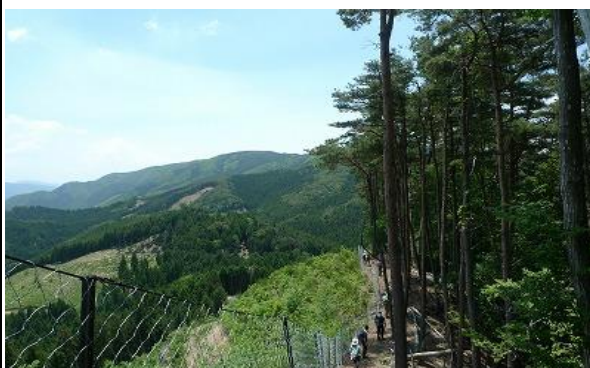
下山途中、これから登る東山が見えています