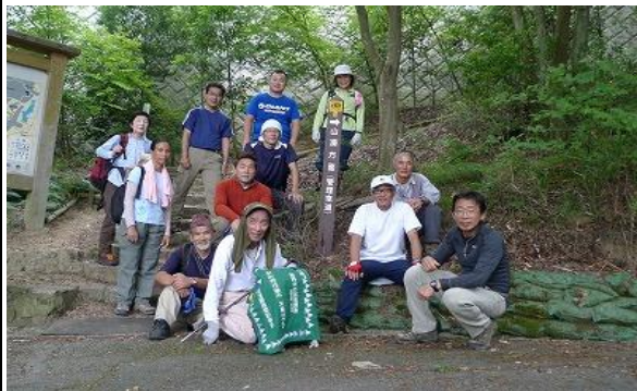
下山してきました