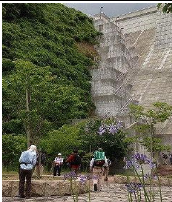
石井ダム（左の階段を登ります）