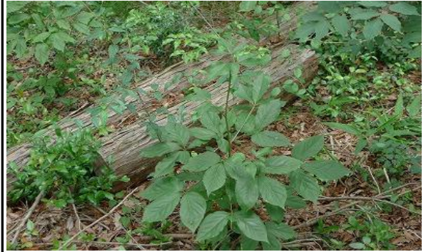
タカノツメで新芽が食べ頃（特徴は3枚葉）