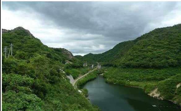
ダム湖の舗装道を歩き妙号岩へ