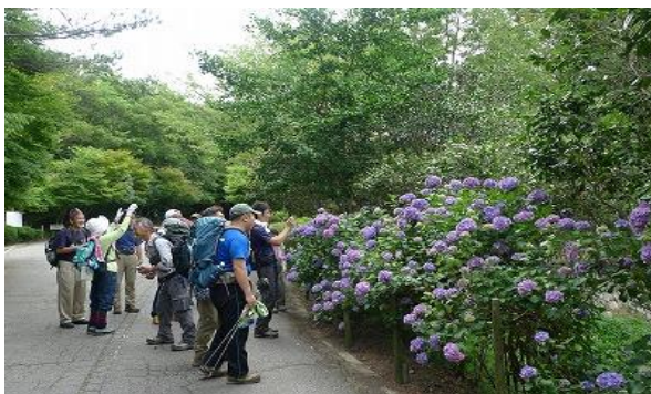
紫陽花もちょうど見頃でした