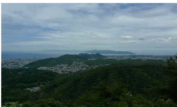
明石海峡大橋もバッチリ見えますね