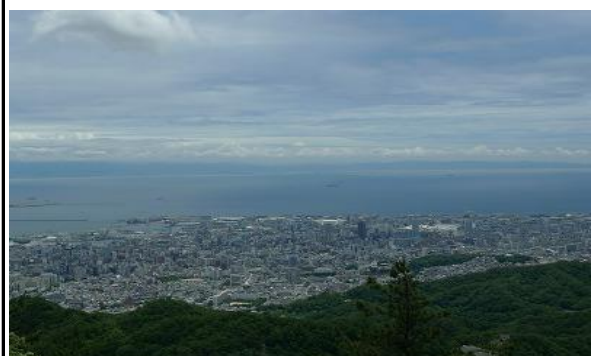
神戸の街並みも今日は鮮やかに見えます。関空も