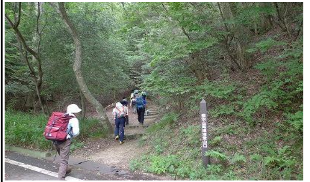
尾根道コースに入っていきます