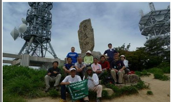
菊水山の山頂です