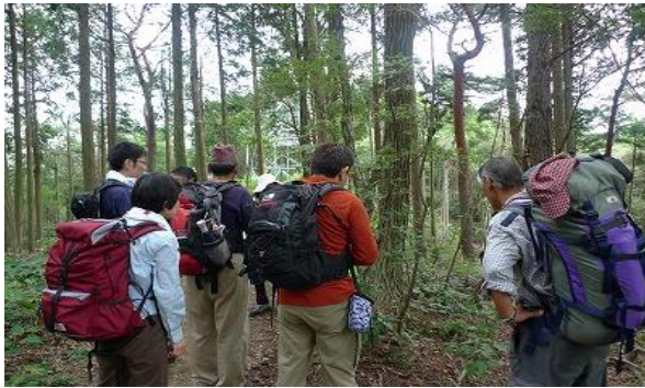
文蔵さんから野草のレクチャーを受けます