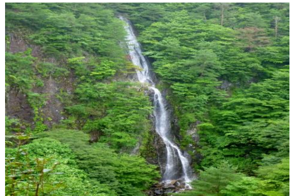
滝見展望台から扁妙ノ滝7.0m全容