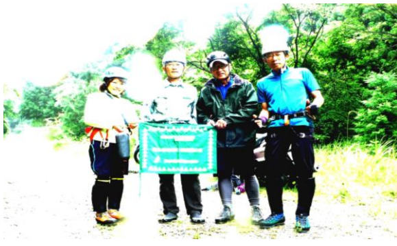
滝ノ谷出合の林道から入谷出発