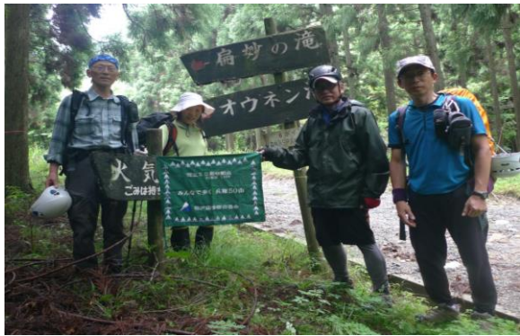
滝ノ谷出合近くの林道へ下山