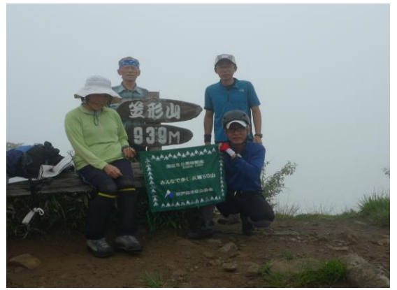
笠形山939.4m一等三角点頂上