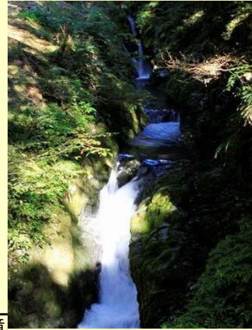
不動の滝 見逃しそうな地味な滝です