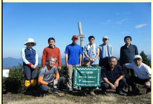
東床尾山、快晴の山頂からは360°の 展望が開けます