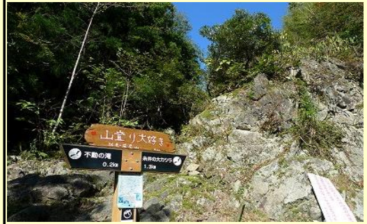
降りてきた羅漢谷出合、 西床尾山の登山口になります