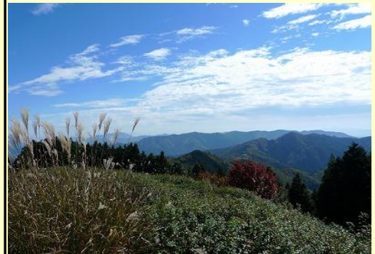
丹波の山並み 部分的に色付いています