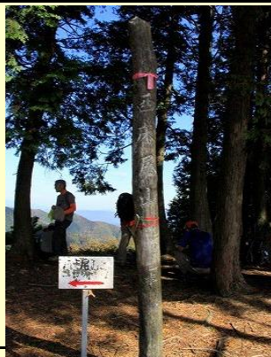
西床尾山は木々の中で展望は少々劣ります