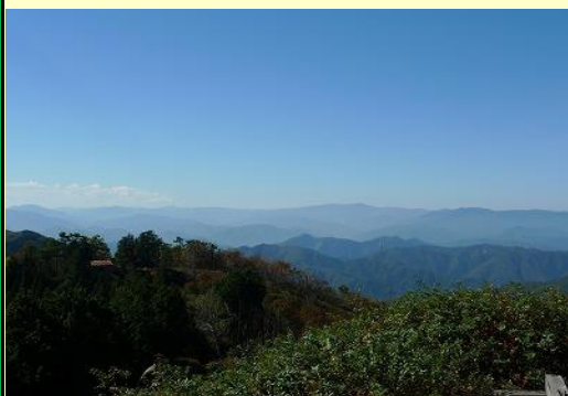
中央奥には氷ノ山も見えます