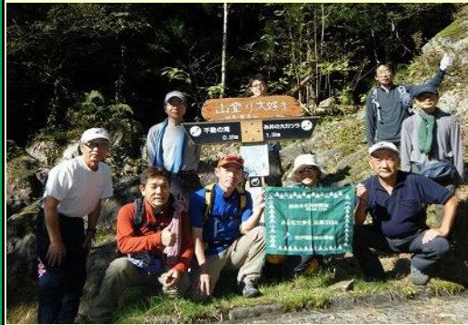
無事に下山してきました。ところで、リーダーが 写真に写っていませんが何故でしょう・・・