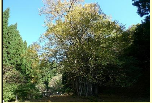
糸井の大カツラ 孫生え全周 - 19.2メートル 一見の価値あります