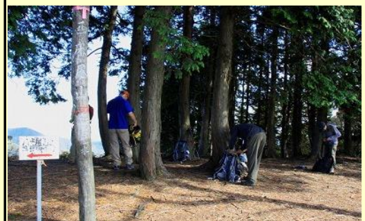
山頂標識は木に彫りこまれていました ここから急な下りです