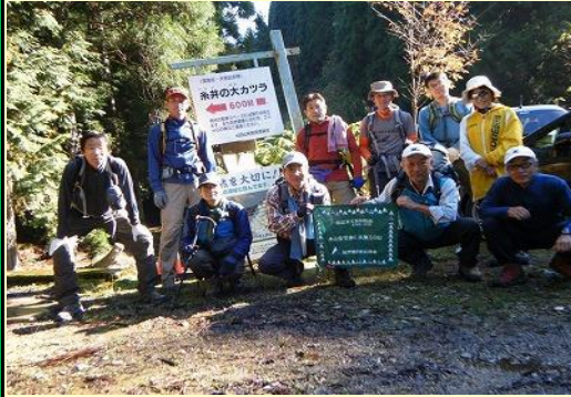
出発は駐車場の登山口