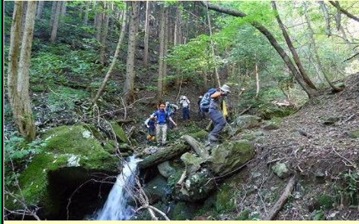
羅漢谷、滑りやすいので慎重に・・・