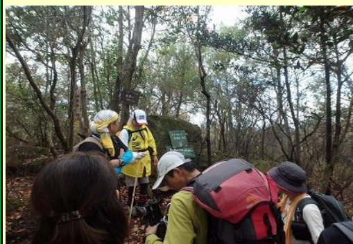
正面は男岩、手前下方には女岩 どちらにも触れて力を貰う