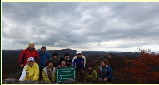
惣山で昼食後に。後方はこれから登る紅山