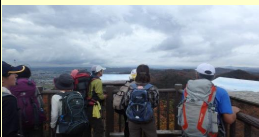
小野見山の展望デッキ 周囲の景色の説明パネルを見ながら眺める