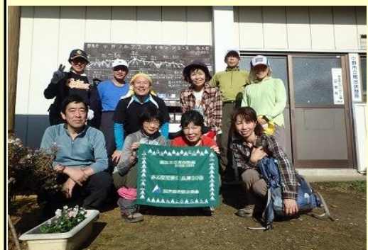
鴨池駐車場で終了写真、雨に降られず皆満足顔 ここから車でゆぴかに向かいます。お疲れさま