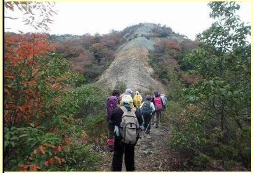
紅山の下に着きました。少し緊張？