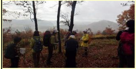
高山からの展望。 北西方面以外は良い見晴らし