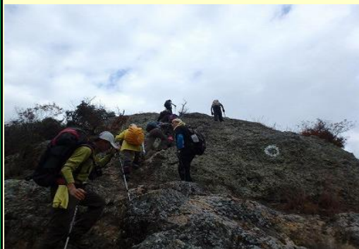
紅山頂上まであと少し、ガンバレ！ 足場はしっかりしていて安全です