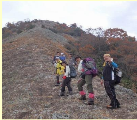
後ろを振り返って、ハイ、ポーズ。 まだまだ元気です。