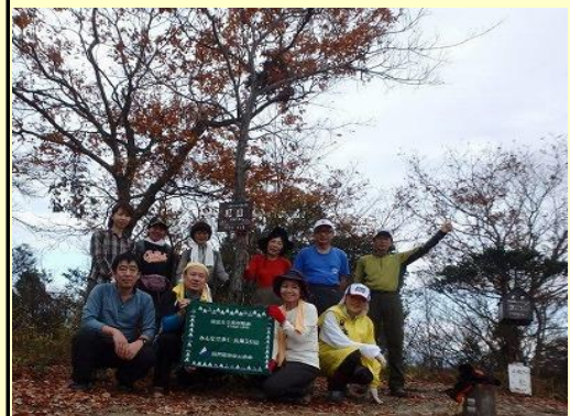
紅山頂上で、ヤッター、ホッとしたー、 がんばったー