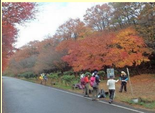
アザメ峠・峠の地蔵、少し休憩。ポイすてやめての 看板の奥には粗大ゴミ有り。地蔵もビックリ?!