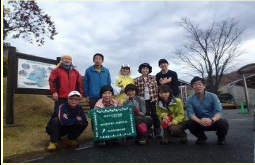
ゆぴか駐車場に全員集合 雨は止んでいます。さあ、これから出発