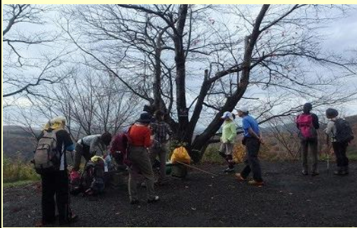
前山(NTT電波塔) 暖かいので上着を脱ぎます