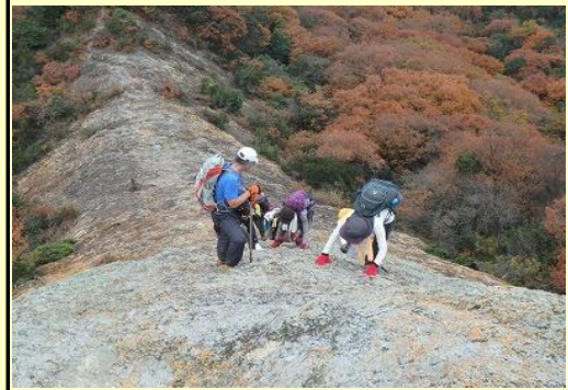
上に行くと急な斜面になり、 手も使ったのハイハイ歩行