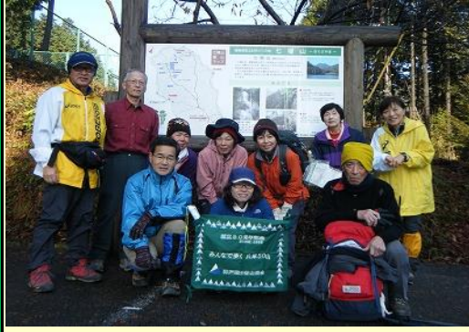
9:30センター駐車場から出発