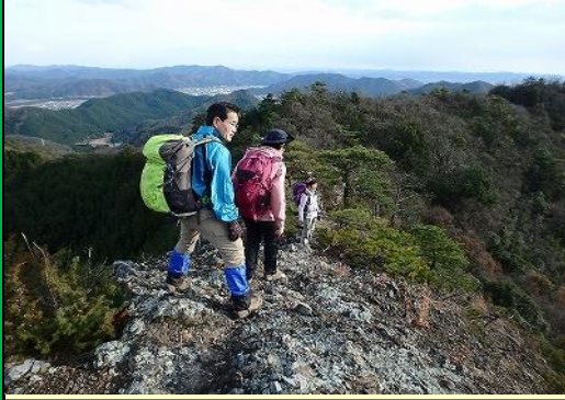
やせ尾根、急な登り下り