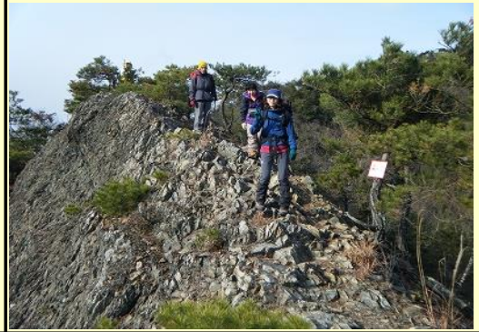
足元はとがった岩