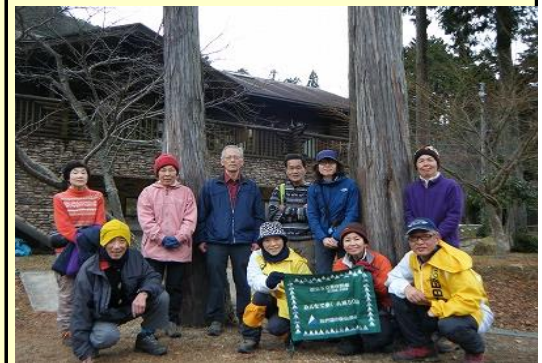
16:00 野外センターに下りてきました 長時間お疲れさまでした