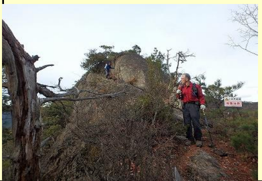
景色も楽しみたいけど