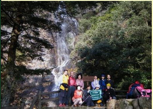
10:40 七種神社境内から七種滝を望む