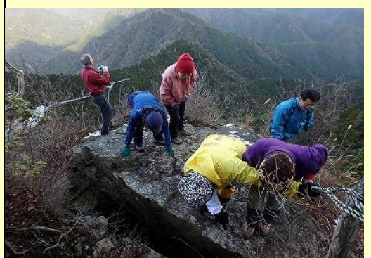
頂上の北東にあるつなぎ岩 隙間を覗き込むが ロープが手放せない