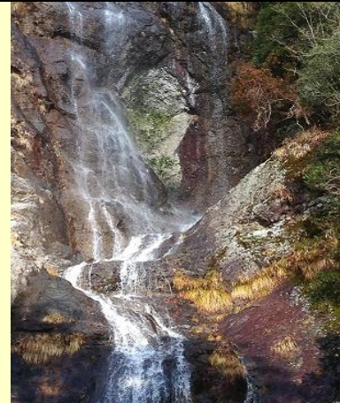
前日の雨のおかげで 七種滝の水量は多かった