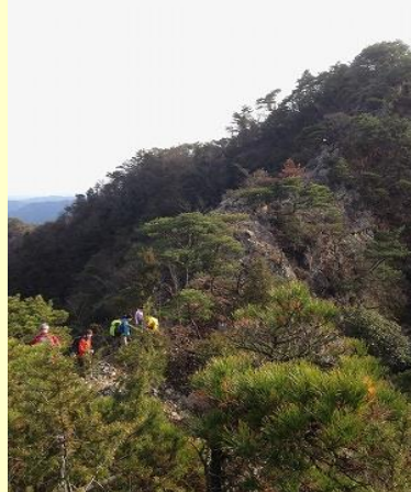
下山道はあのピークの向こうかな