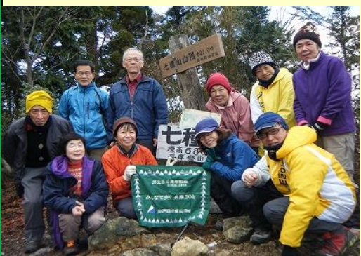
12:15 昼食後の七種山頂 ここからの縦走路が長かった