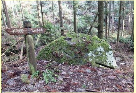
弁慶が切ったといわれるのこぎり岩