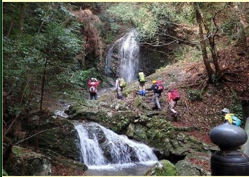
太鼓橋を渡ると 急な登りが始まり いくつか滝が現れる