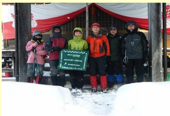
出発前の安全祈願