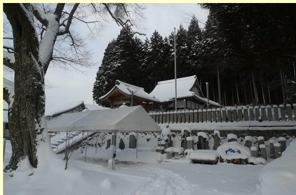
道仙寺護摩堂 標高520m