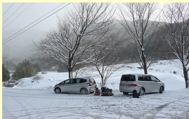
道仙寺護摩堂の駐車場