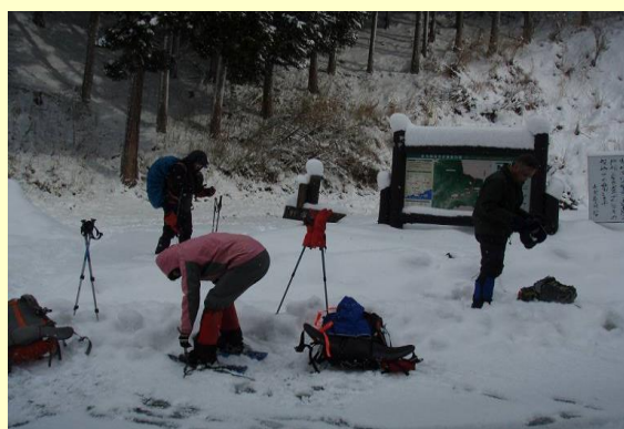
林道入口（ワカン装着）