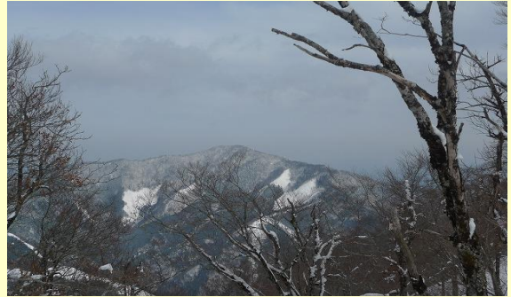
3月に予定している藤無山