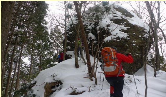
南尾根の大岩です。左を巻きます。