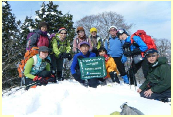
ここが三久安山のピークですが標識は雪の下だと思われます