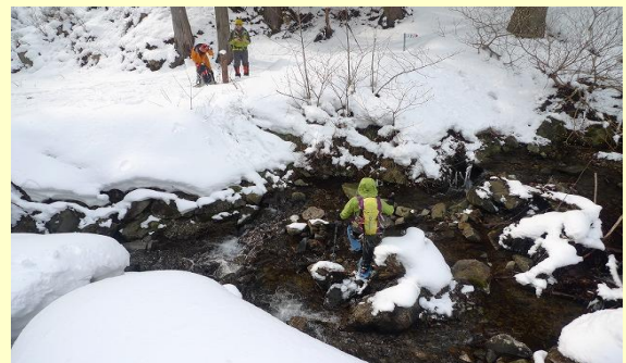
沢を渡って登山口に戻ってきました。