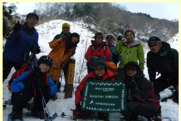
24番目の「50山」終了お疲れさま---楽しかったよ！