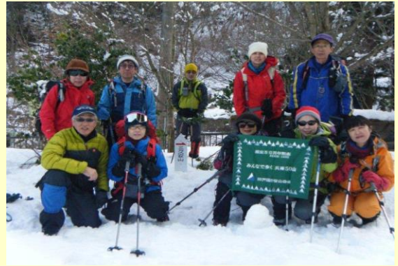
せせらぎ公園から出発