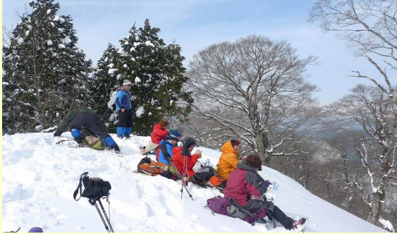
山頂での昼食も快適でした