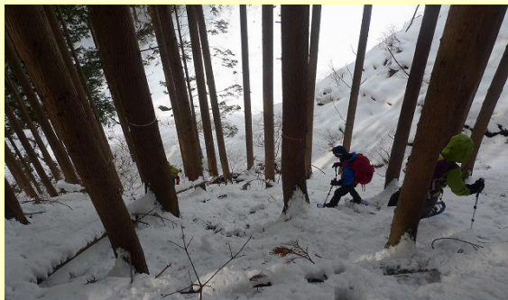
尾根の最後は激下りでした。