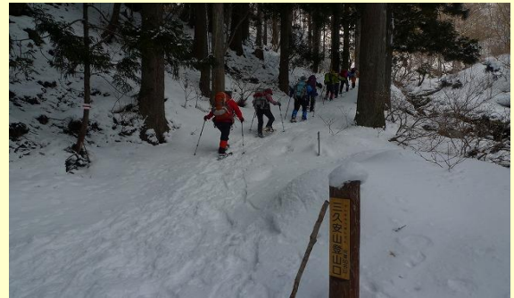
林道終点の登山口