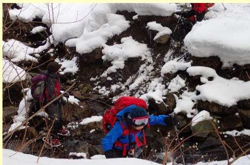
細い橋がありました崩壊すると思います。