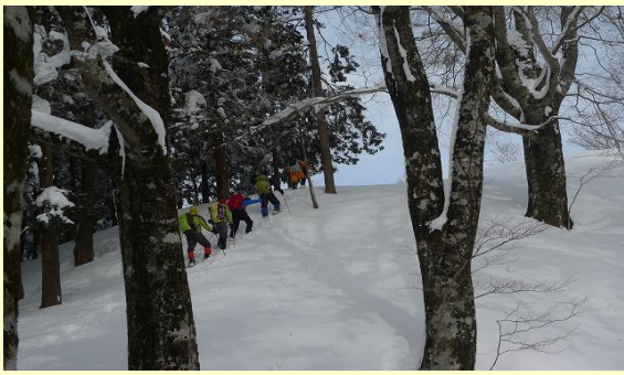
山頂手前のブナ林