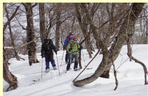
これぞスノーハイクでしょ！