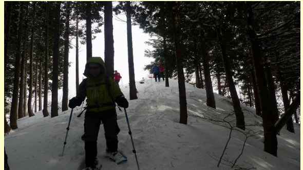
932mから西の尾根を下ります。