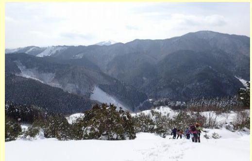
一山・阿舎利山を望む