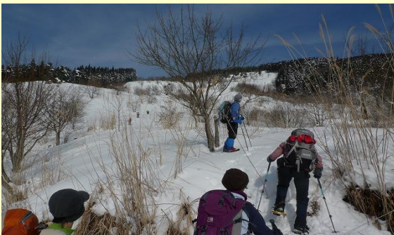
林道から伐採地を直登