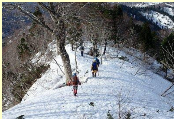
雪がしまっていて歩き易い尾根