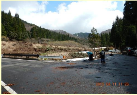
姫路集落先林道右が入口（ここから雪）