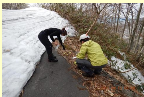
フキノトウを発見