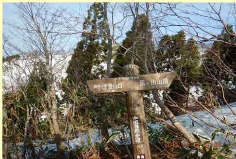
下りの一つ目の標識