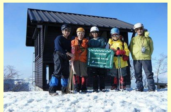
扇ノ山山小屋（H5築） 2階に大阪労山3名