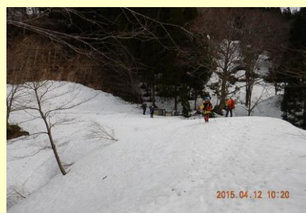
やっと登山口に戻ってきた