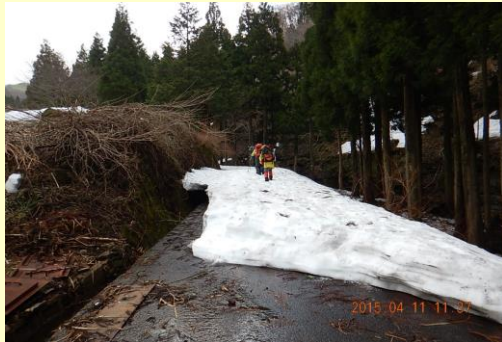
姫路集落先林道入口（ここから雪）