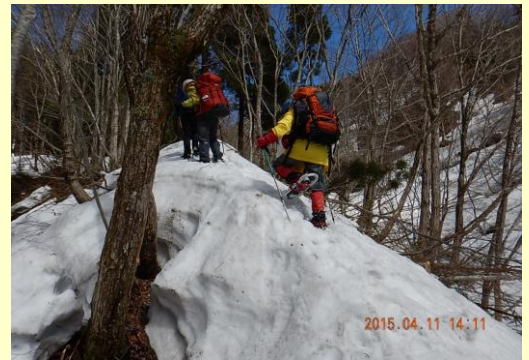
尾根の様子。この先ブッシュあり