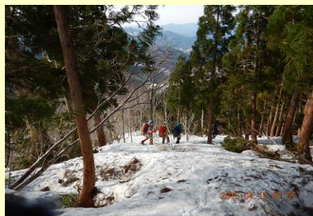
2つ目の標識から南への尾根へ（誤り）