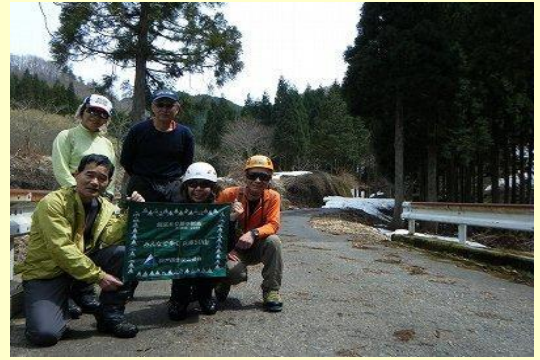
集発前恒例の記念写真