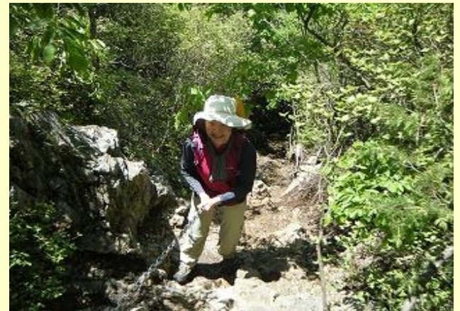
小金ヶ嶽の登り下りとも 岩場・鎖場があります