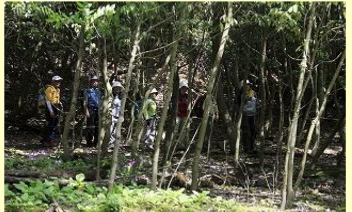
登山道から西にはずれて クリンソウを探します