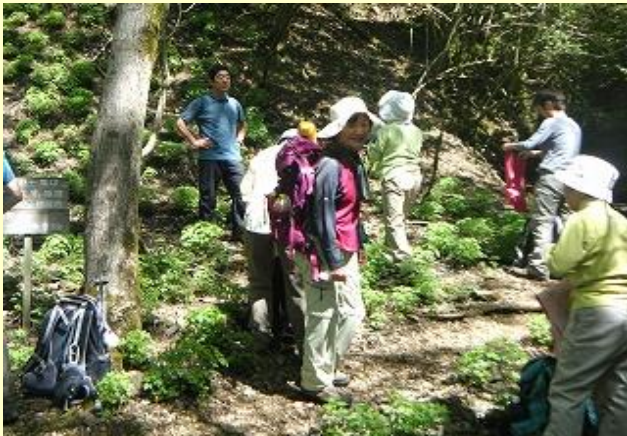
クリンソウ自生地だそうです・・・ないねえ