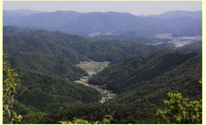
今日登ってきた火打岩方向の眺め