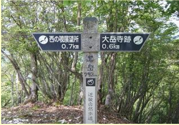
大岳寺と書いて『みたけ』と読みます