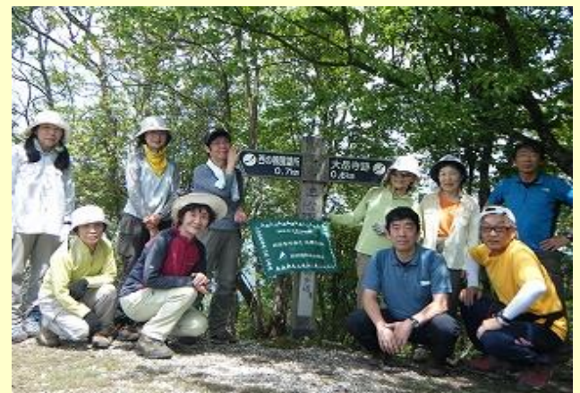
三嶽山頂ですが、『みんなで歩く兵庫50山』には選ばれていないのでポイントはもらえません