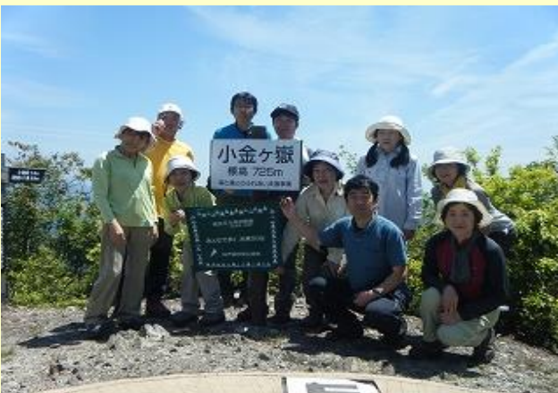
ここで早めの昼食