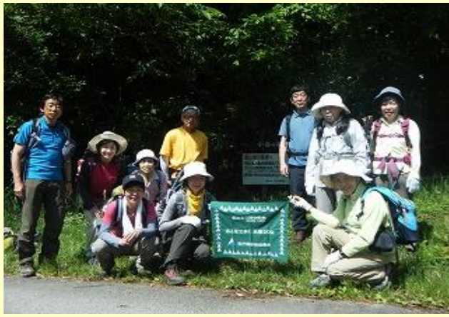
今日は2山ラウンドで まずは小金ヶ嶽に向かいます