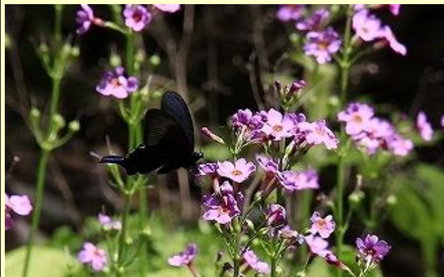
クロアゲハが蜜をすっています