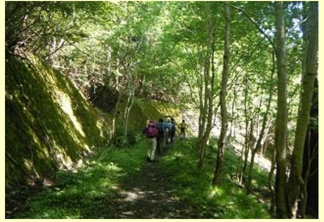
気持ちのいいハイキング道です