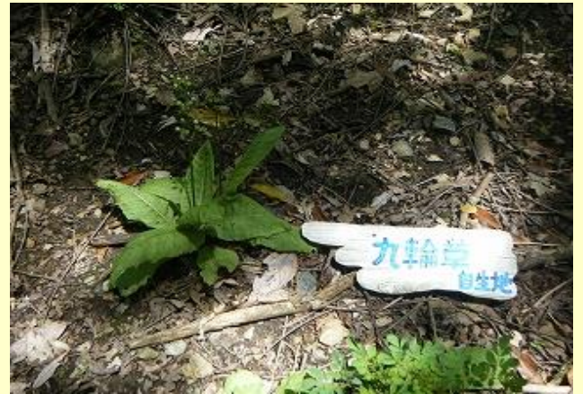
株もあまりなく、花はとっくに終わっている様子