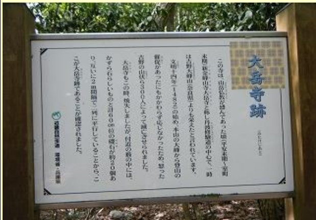
本山の大峰山からの登山の催促に応じなかったため 1482年焼き討ちにあったそうです