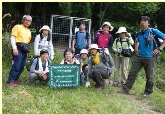
またクリンソウの時期にきたいですね