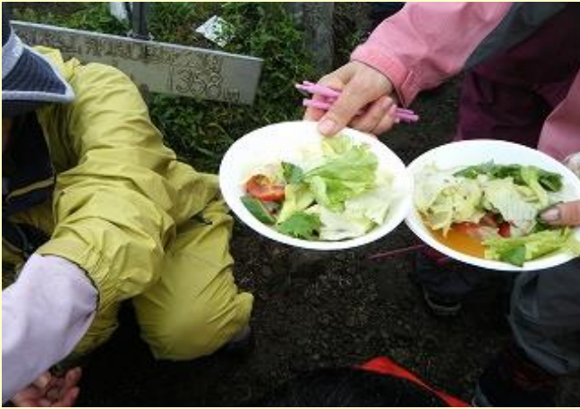
頂上で昼食。兵放ハイクではおなじみらしいサラダが 手際良く24名分つくられる