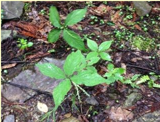
フタリスズカのつぼみを見つけた