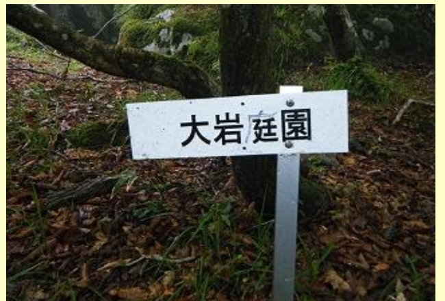
ここから岩場、鎖場が出てくる 岩は濡れているし、道はぬかるんでいる 帰りも通るが、ここでは絶対滑りたくない