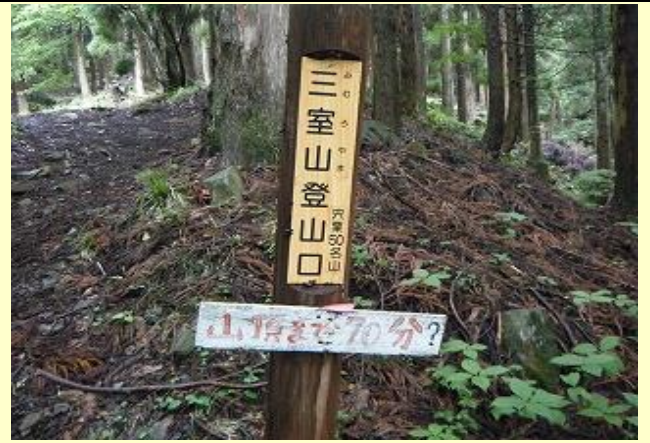
ここまで20分、林道終点に登山口がある