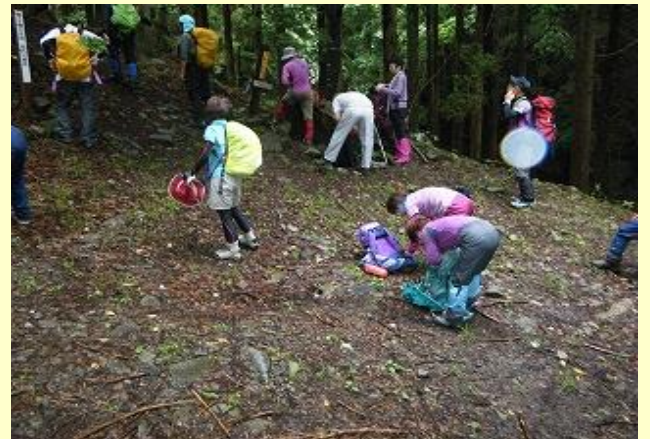
雨が止んだので雨具を脱ぐが、動かないと寒い