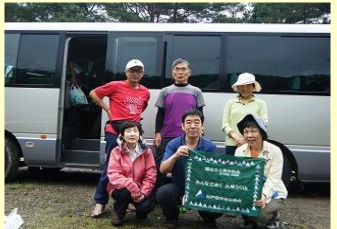
お付き合いいただきありがとうございました