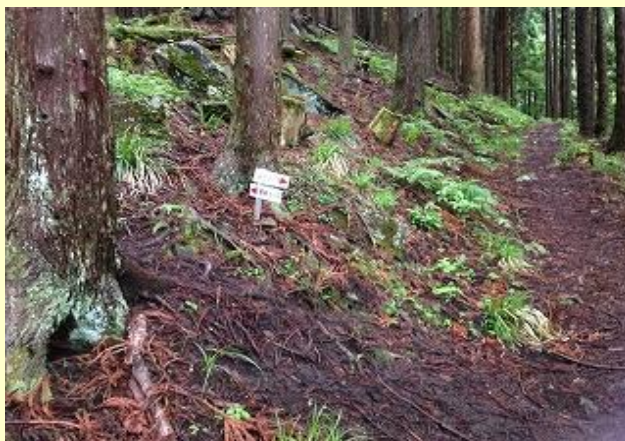
左の尾根道を行くが、10分ほどで合流する