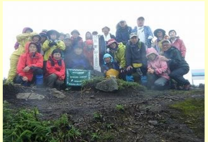
カメラはこれ以上下がれないので 帽子しか見えていない人もいるが、よしとする