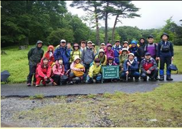
三室高原駐車場出発 兵放ハイクとの合同は2度目