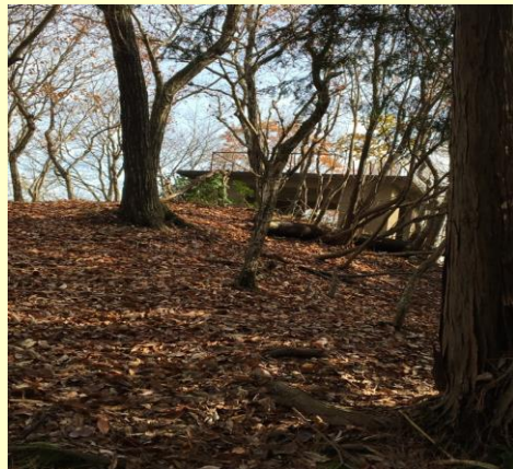
展望台です。落ちていた栗はリスさんに食べられて入っていませんでした。