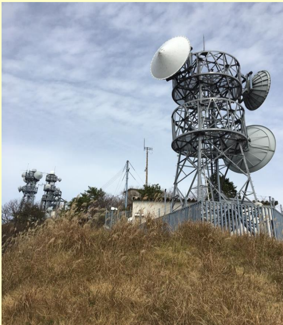
頂上付近。巨大な電波塔