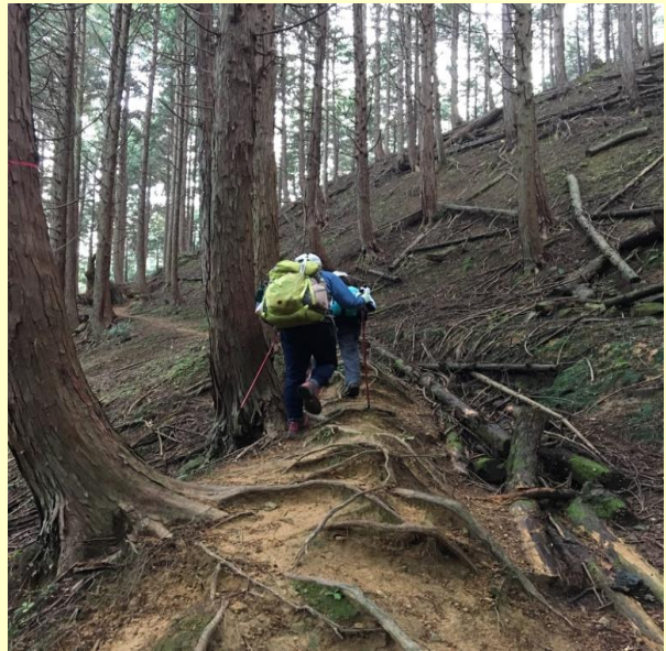
雪山を想像するとワクワクする道です。