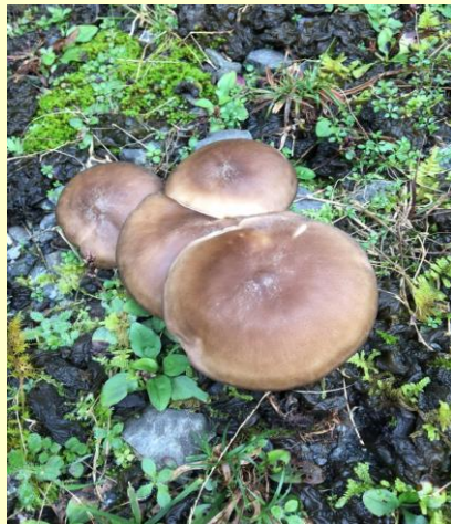
登山口で見つけたキノコ、食べれますか？