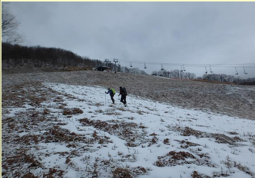
オープン前のスキー場を登っていきます