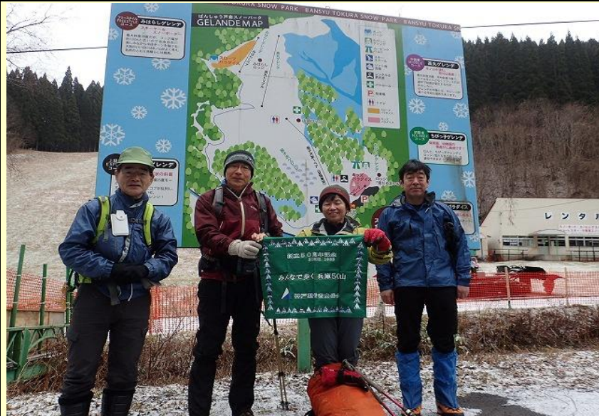
登山口の戸倉スキー場