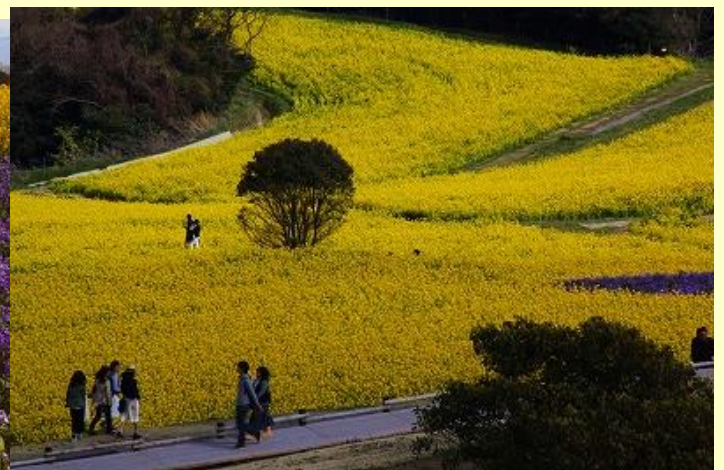
富良野に雰囲気似ています