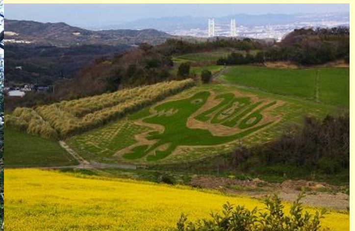
花さじきの向こうに明石大橋を望む