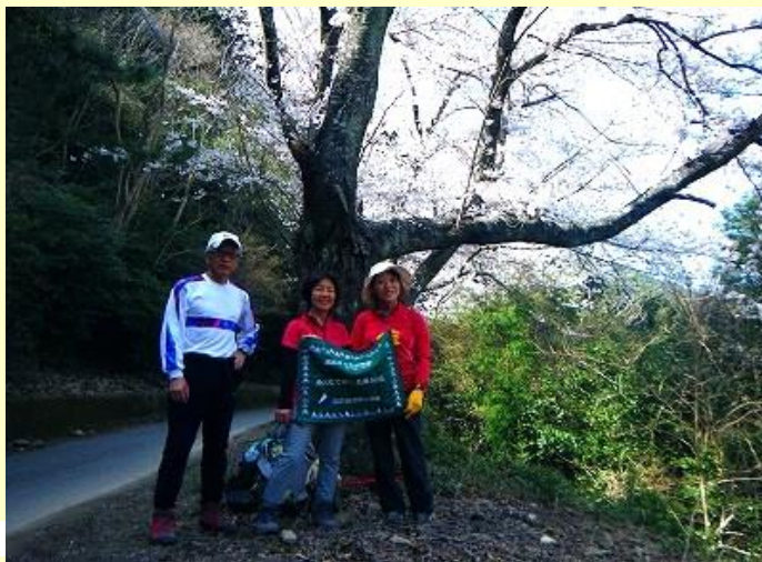
ダム横の桜と下山写真