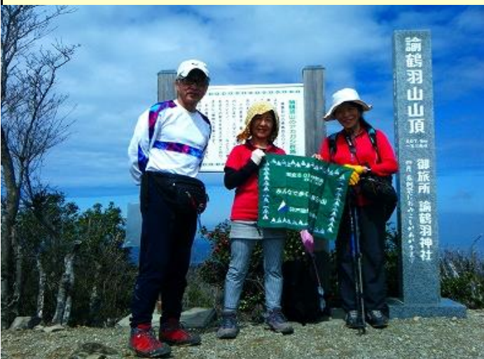
一般参加者は元会員で旧知の仲です 変わらず姿勢が良く若いままです