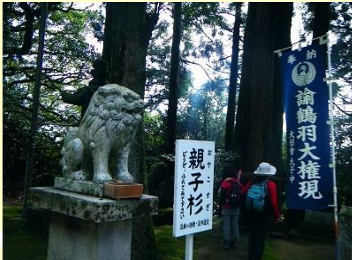
「親子杉」は兵庫の巨樹巨木に選定されてている