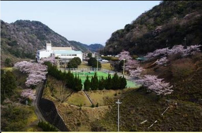
諭鶴羽ダムの子クリングターミナル