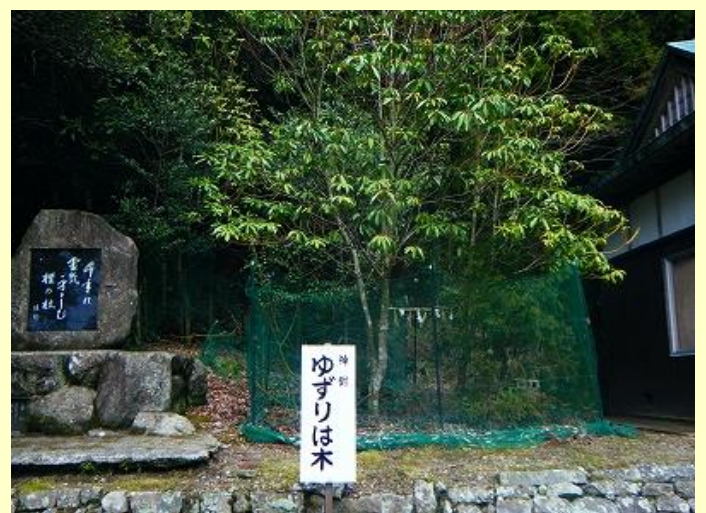
諭鶴羽山の名前の由来になったという「ゆずりは」の木