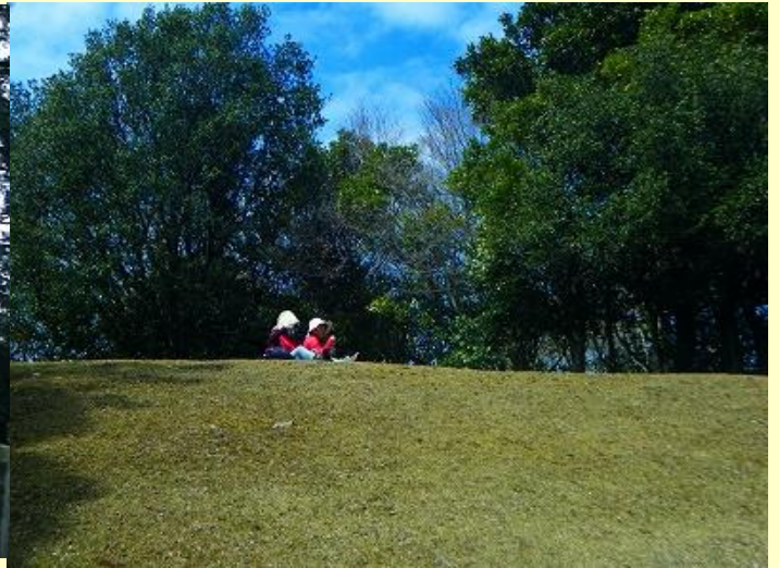
戦没者を慰霊する「山ボウシの広場」で昼食