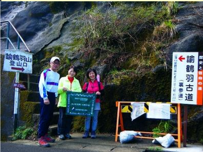
諭鶴羽山へはダムの横の階段を上がっていきます