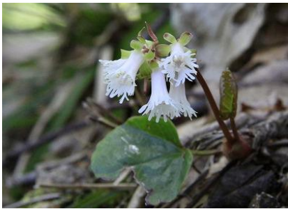
4 三川山 白色イワカガミ