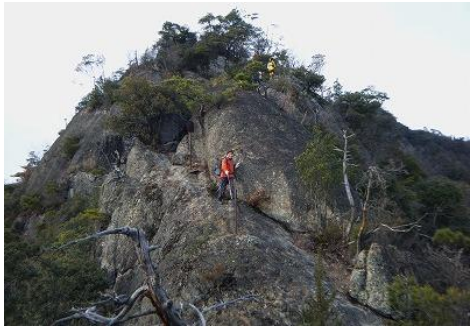
21 七種山 景色も楽しみたいけど