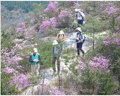
2 笠松山 ツツジ尾根