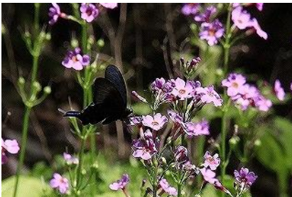
32 小金ヶ嶽 クリンソウ