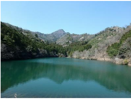
25 岩屋池に映る《逆さ明神山》