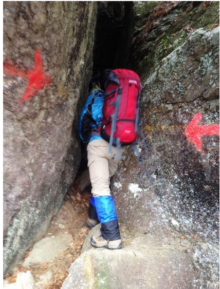
20 雪彦山 奥はもっと狭くてザックを背負っては通れない