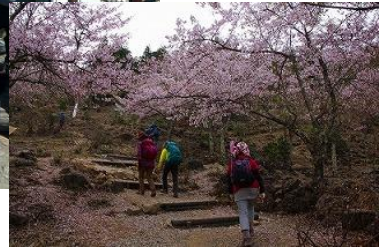
48 朝来山 仰げばサクラ 振り返れば竹田城