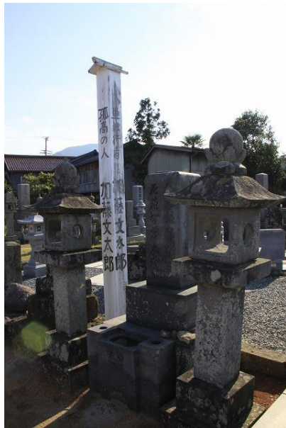
17 観音山 幾人にも たずねてやっと見つけた加藤文太郎の墓