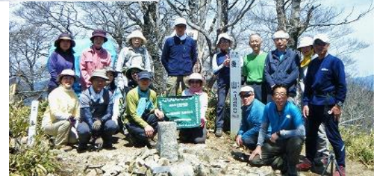
49 展望の良い後山山頂 昨年雪に阻まれ途中リタイヤした事を思い出す