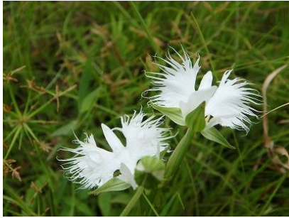
13 西光寺山 サギソウ観賞後山頂で集中豪雨に見舞われる