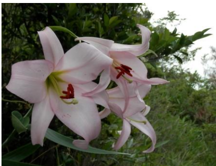
9 高御位山 ササユリ