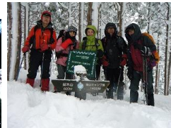
←「幻となった雪の後山」