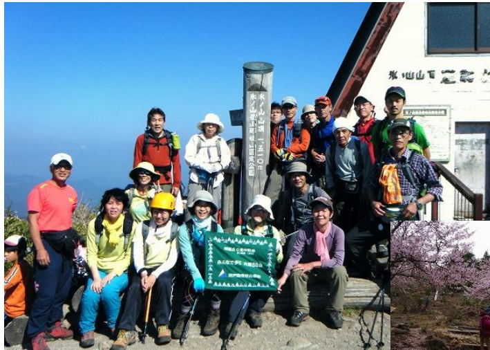
38 兵庫県標高1位の氷ノ山は大人気で9名もの一般参加があった