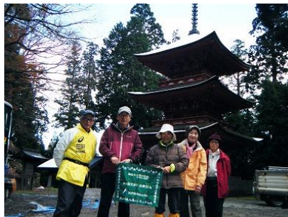
41 妙見山名草神社の由緒ある三重の塔