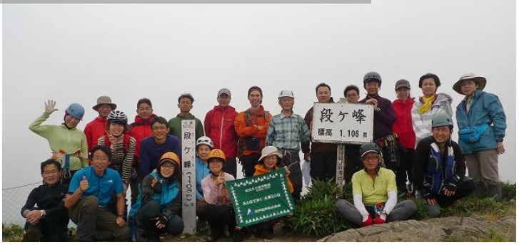
12 小雨の段ヶ峰山頂で尾根班が沢班を1時間待って合流、総勢23名「50山」最多記録