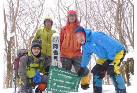
44 「50山」雪山6座目の阿舍利山 寒いので山頂写真を撮り即下山開始