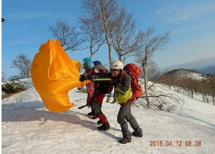
26 扇ノ山山頂小屋泊 早朝1時間は強風の中でのツェルト訓練