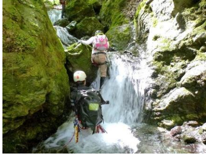
35 須留ヶ峰は水量とヒルが多く 尾根組との山頂合流は間に合わず