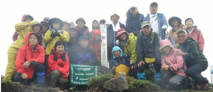
33 三室山山頂は意外と狭い 兵放クラブとの合同山行で人数が多いが、ハイキング良しとする