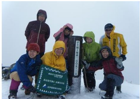
22 雪の千ヶ峰山頂では昼食タイムも惜しみ無線の特訓が行われた