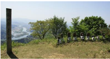
28 山頂には、たくさんのお地蔵さま 円山川と玄武洞方面が見える