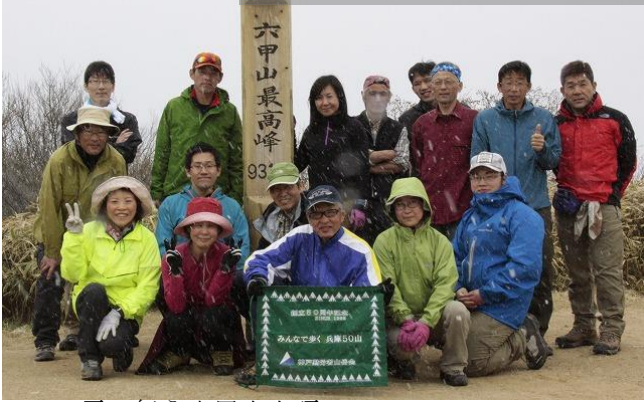
1 雪の舞う六甲山山頂