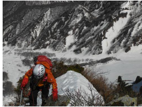
楽しい登攀でーす！