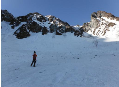
いいお天気。登るコースもよく分かる！

⑨ この春の大山北壁デビューは、1回目天候と雪の状態が非常に悪く、取り付きでの撤退となったが、2,3回目は天候、雪の状態に恵まれ楽しい登攀となった。神戸から4.5時間ほどで行け、コースも多く、取り付きへのアクセスも非常に良いので、毎年企画したい山となった。1回目撤退したメンバーで登れた事も嬉しかった。トランシーバーは今回も有効だった。