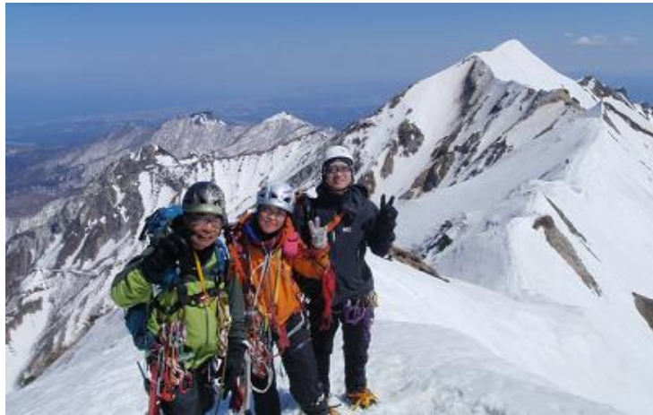
やったね！3人で頂上！またきまーす。♥。°♡°。♥。·