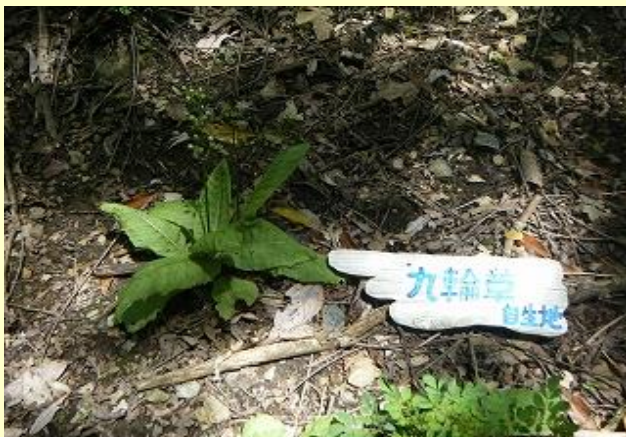
株もあまりなく、花はとっくに終わっている様子