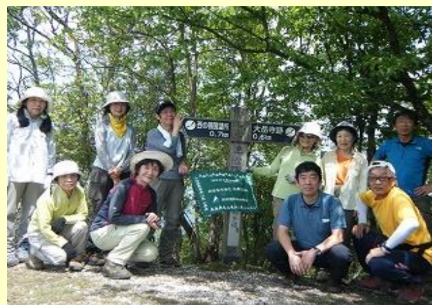
三嶽山頂ですが、『みんなで歩く兵庫50山』には 選ばれていないのでポイントはもらえません