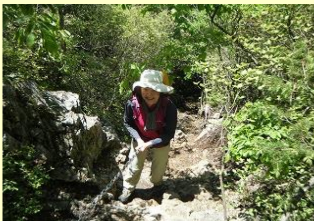
小金ヶ嶽の登り下りとも 岩場・鎖場があります