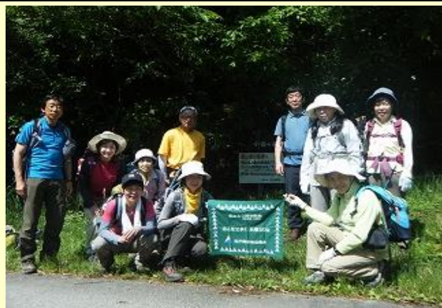
今日は2山ラウンドで まずは小金ヶ嶽に向かいます