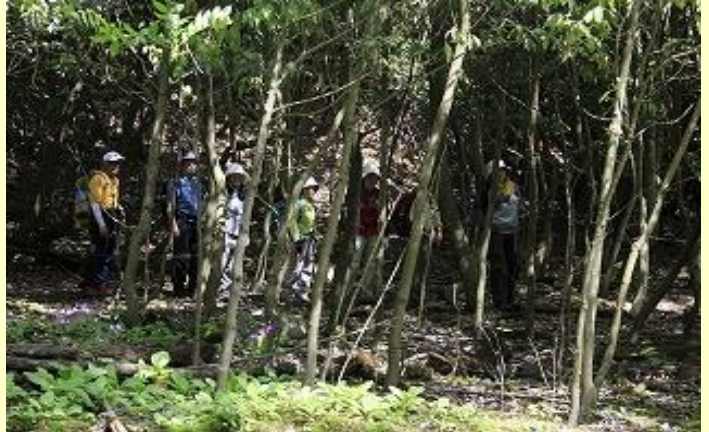
登山道から西にはずれて クリンソウを探します