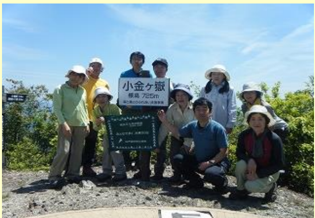
ここで早めの昼食