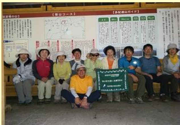
大たわ峠には 立派な休憩所と きれいなトイレもあります