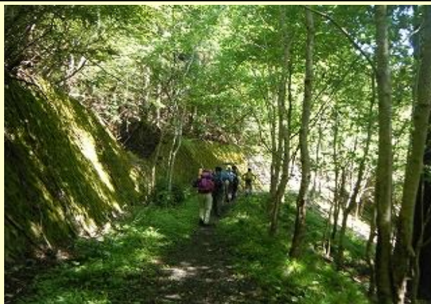
気持ちのいいハイキング道です