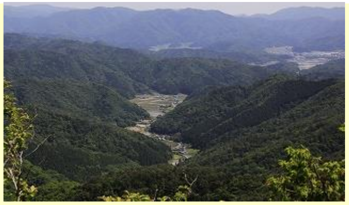
今日登ってきた火打岩方向の眺め