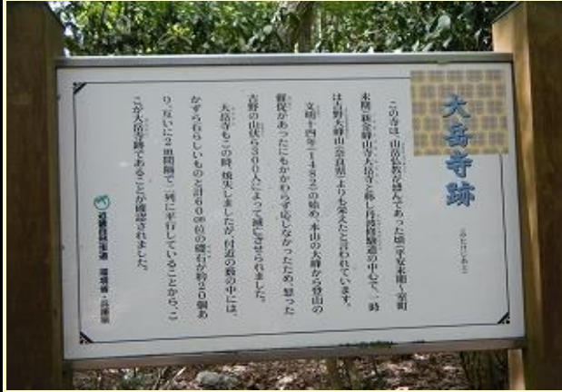
本山の大峰山からの登山の催促に応じなかったため 1482年焼き討ちにあったそうです