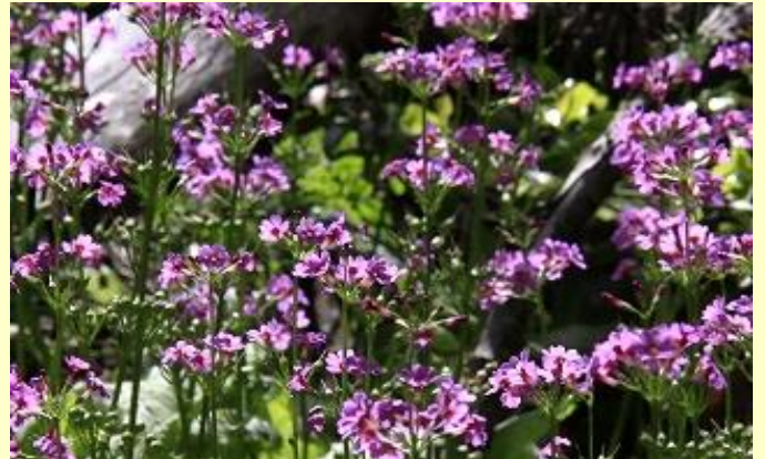
たくさんのハイカーが見に来ていました