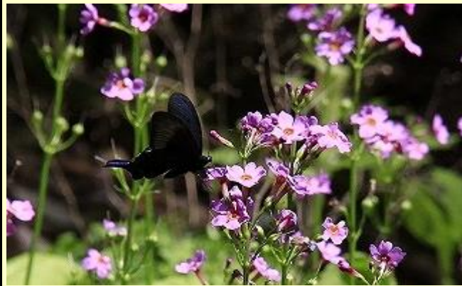
クロアゲハが蜜をすっています