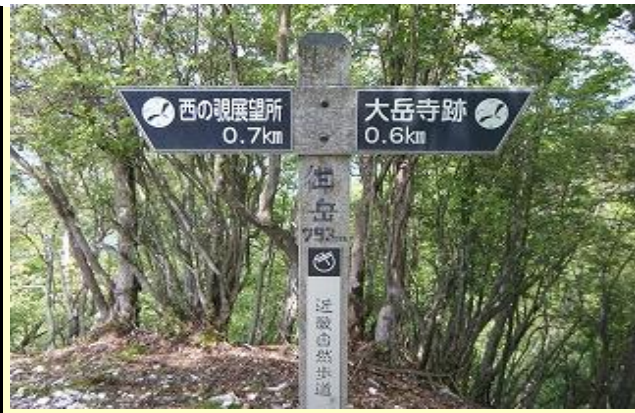
大岳寺と書いて『みたけ』と読みます