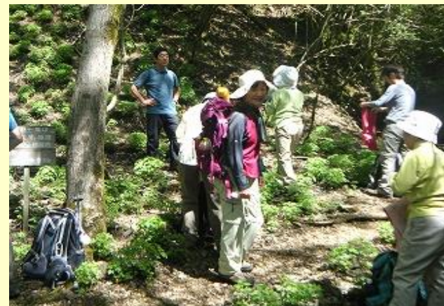
クリンソウ自生地だそうです・・・ないねえ