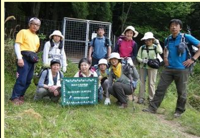
またクリンソウの時期にきたいですね