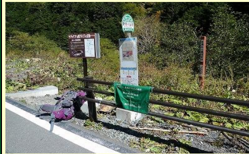
野呂川出合のバス停で終了。 30分程待って北沢峠に戻りました。