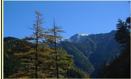
北岳が望めるポイントも有りました。