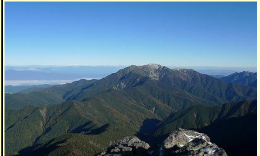
バカ尾根から仙丈ヶ岳。 意外と雪が付いていない。風向きですね。