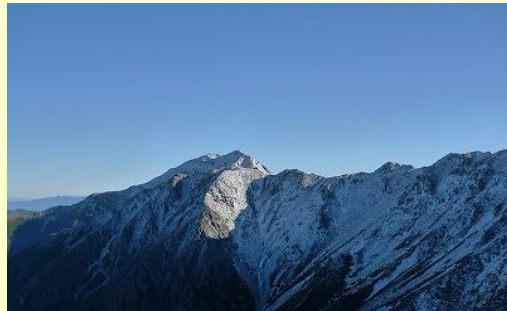
北岳もしっかり雪が付きました。