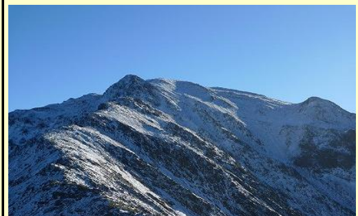
間ノ岳へはアイゼンですね。 人はいるのでしょうか・・・