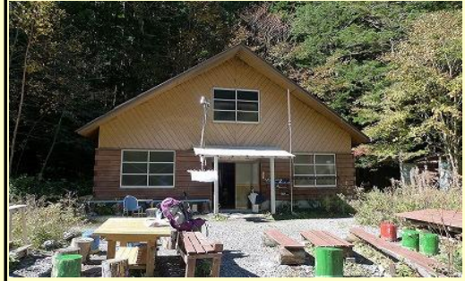
戻ってきました。登山者はすでに下山していました。女主人に挨拶をして林道を下ります。