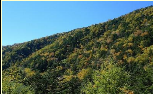
退屈な林道歩きですが紅葉が見事です。