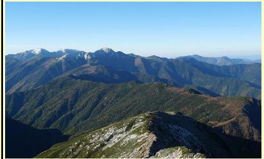
塩見岳に続く山容、その奥が赤石、聖岳 熊ノ平小屋も見えています。