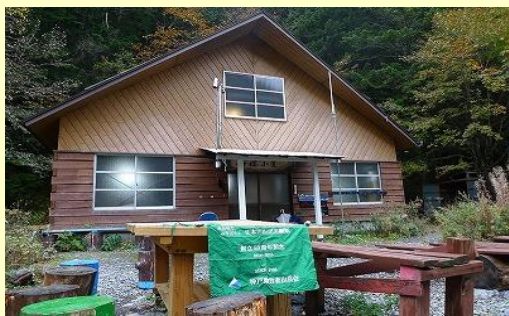
両俣小屋。林道から来た4名のパーティーと単独 が先客でした。営業末期なので大サービスして頂く