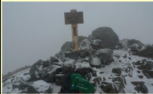
高度を上げるにつれ、雨→みぞれ→雪 →吹雪になる。小仙丈ヶ岳は登山者なし。