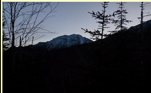
明けて快晴。初冠雪の北岳