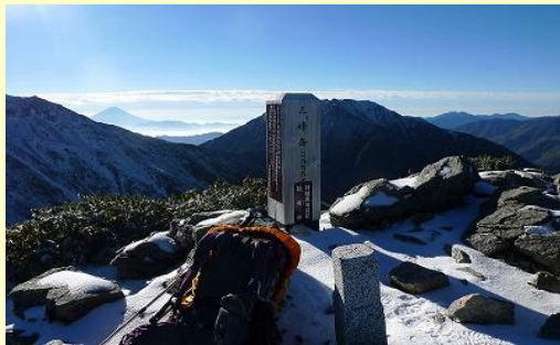
濃鳥岳の奥に富士山