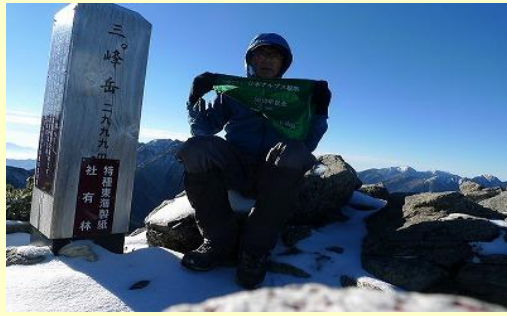
昨年は雨で何も見えなかった三峰岳。 素晴らしい展望です～