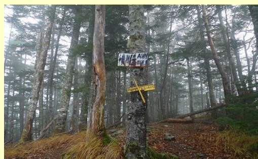
大仙丈ヶ岳を越え、バカ尾根をハイペースで 横川岳。左にルートをとって野呂川乗越。