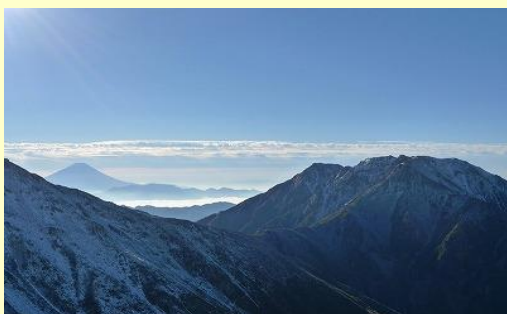
濃鳥岳手前の鞍部に小屋が見えています。 こちらの姿が見えるでしょうか・・・