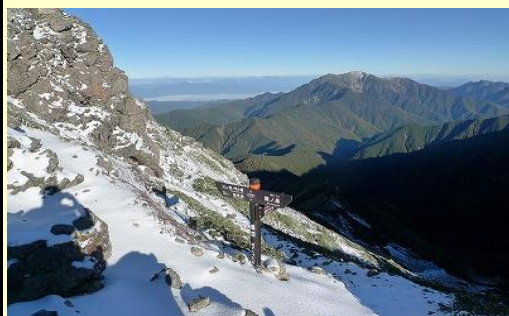
三峰岳直下の分岐点。 風を避けると小春日和