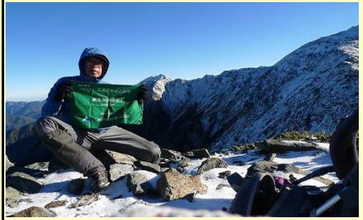
当然登山者は私だけ、この眺望を独り占めです。