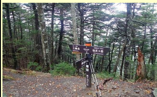
野呂川乗越から両俣小屋へ下る。 滑りやすいので慎重に…ケガをすれば遭難