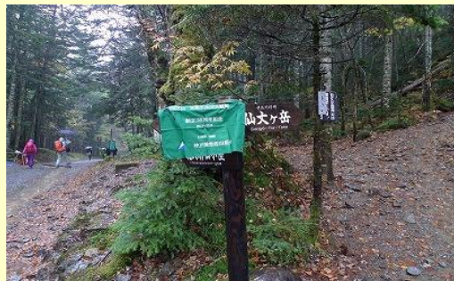
北沢峠から雨の中を出発。 強い雨で登山道が川状態。