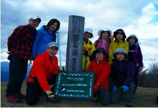
360度の展望の山頂到着