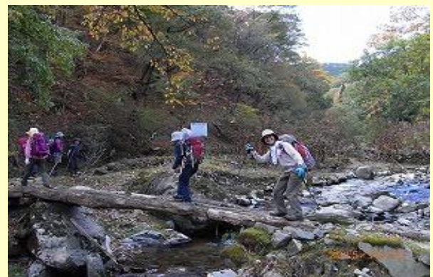
数回渡る丸太の橋・ハイポーズ