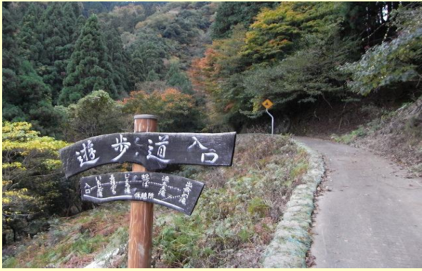
駐車場からすぐの遊歩道入口