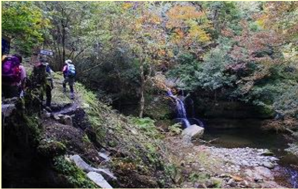
大小たくさんの滝を見ながらの登り