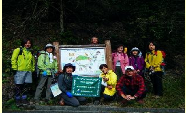
登山口でまずは、記念写真