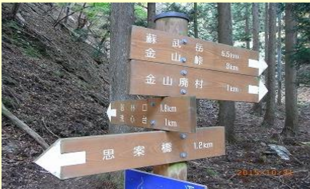
途中まではしっかりと道標