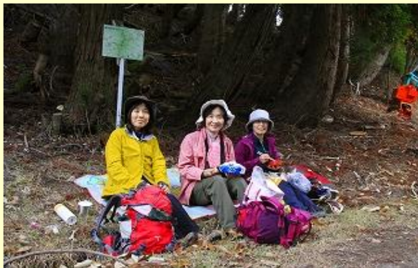
ようやくたどり着いた金山峠で昼食