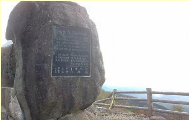
林道にあった石碑 費用にいくらかかったやら