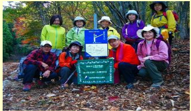
お疲れ様 さあ、温泉へ