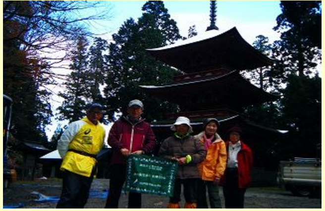
名草神社の立派な三重の塔