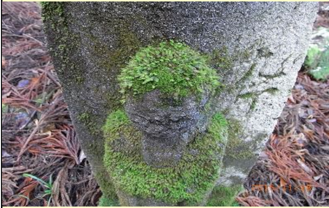
髪の毛ふさふさのお地藏さん