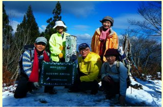
山頂での記念写真