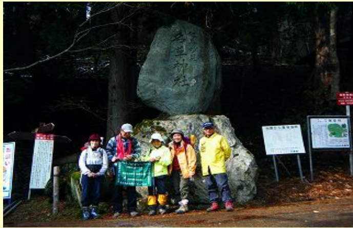
まずは、スタートの記念写真