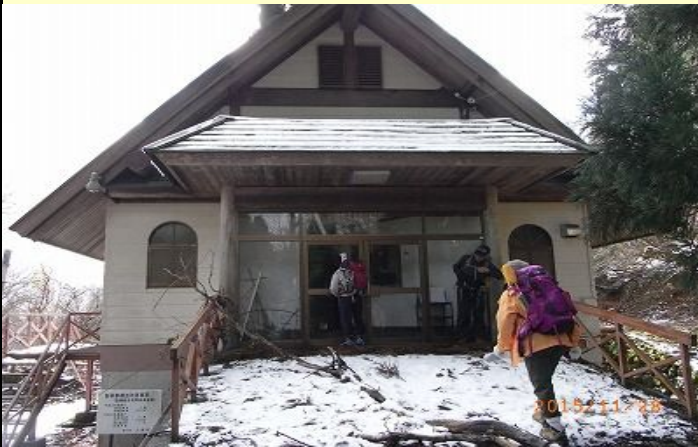
冬は閉鎖しているキャンプ場管理棟