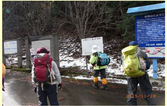
名草神社から登山口まで