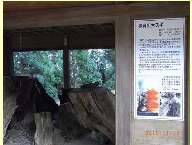
妙見の大スギ・・・でっかい