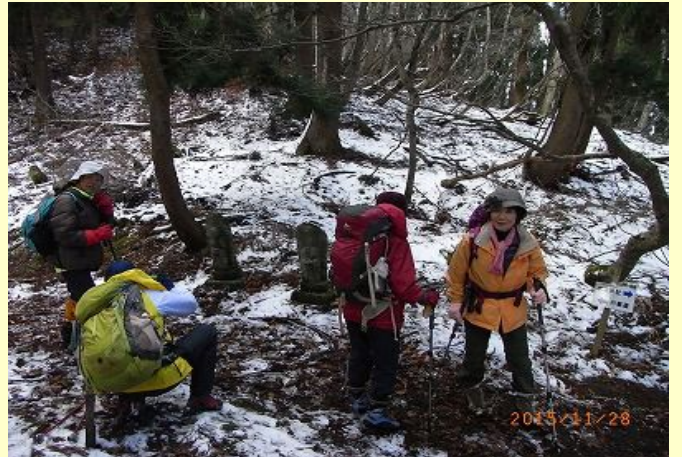
林道経由で峠に到着。2体お地藏さんを撮影。