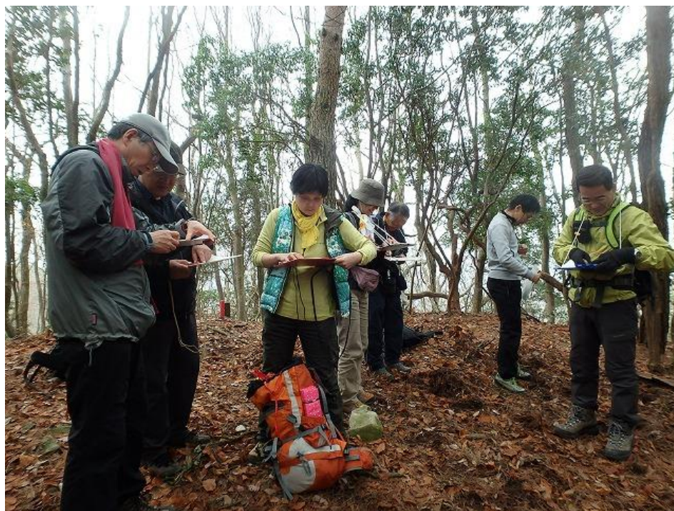
高尾山山頂にて方向確認。