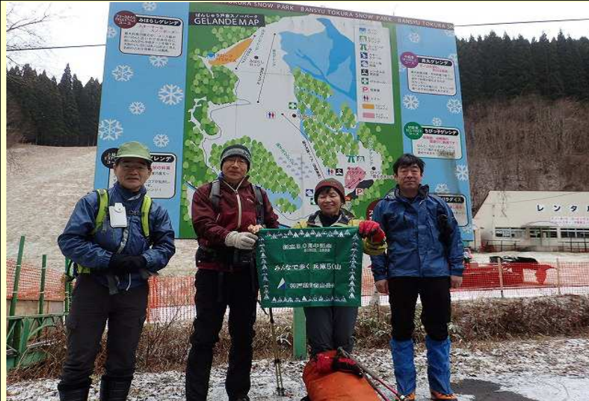
登山口の戸倉スキー場