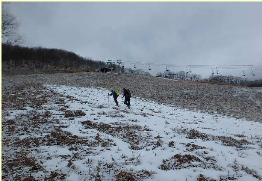
オープン前のスキー場を登っていきます