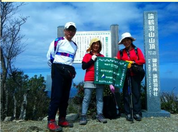
一般参加者は元会員で旧知の仲です 変わらず姿勢が良く若いままです