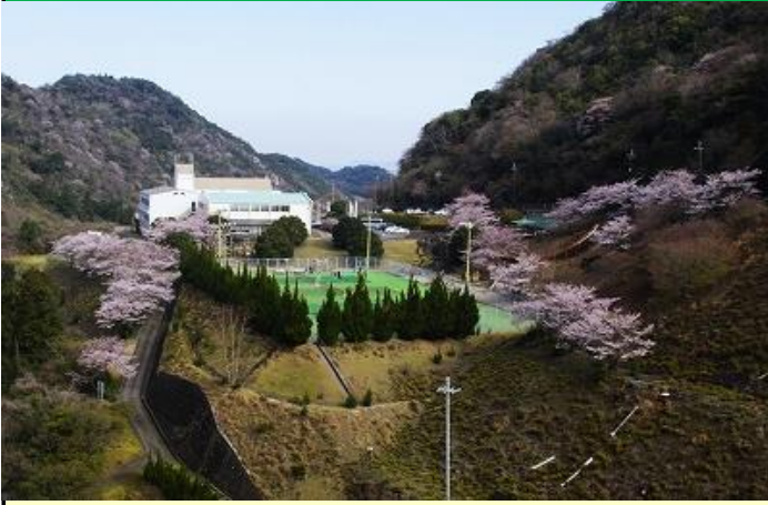
諭鶴羽ダムのサイクリングターミナル