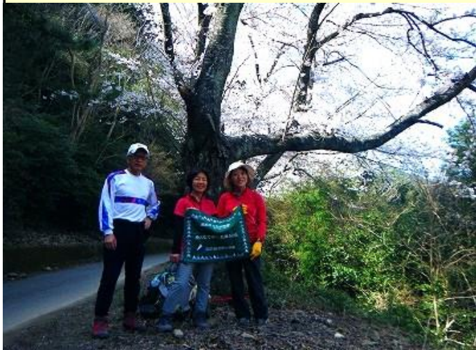
ダム横の桜と下山写真