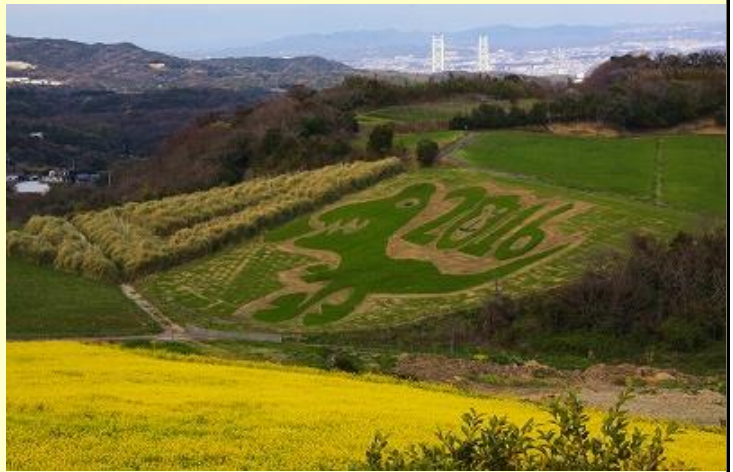
花さじきの向こうに明石大橋を望む