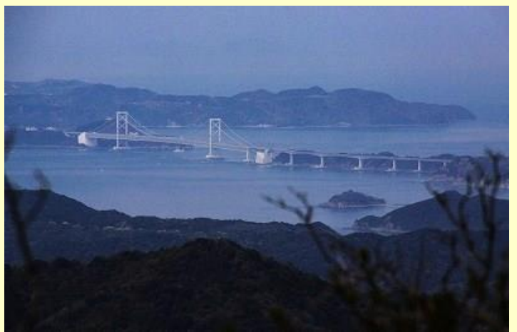
山頂から鳴門大橋が見えます