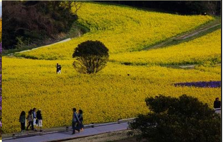
富良野に雰囲気似ています