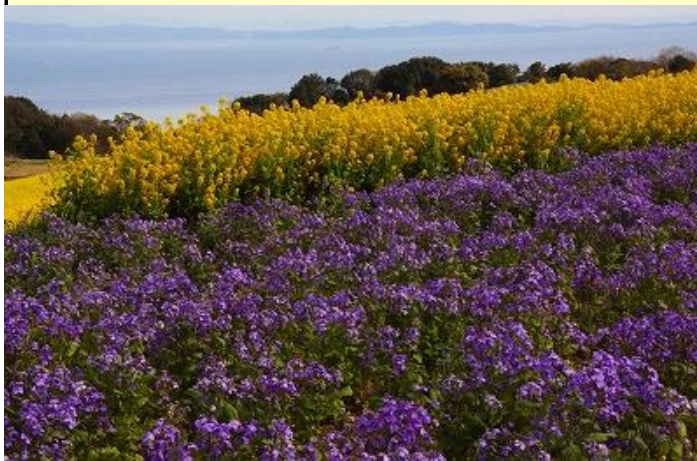
ハナダイコンと菜の花 海の向こうに見えるのは和歌山