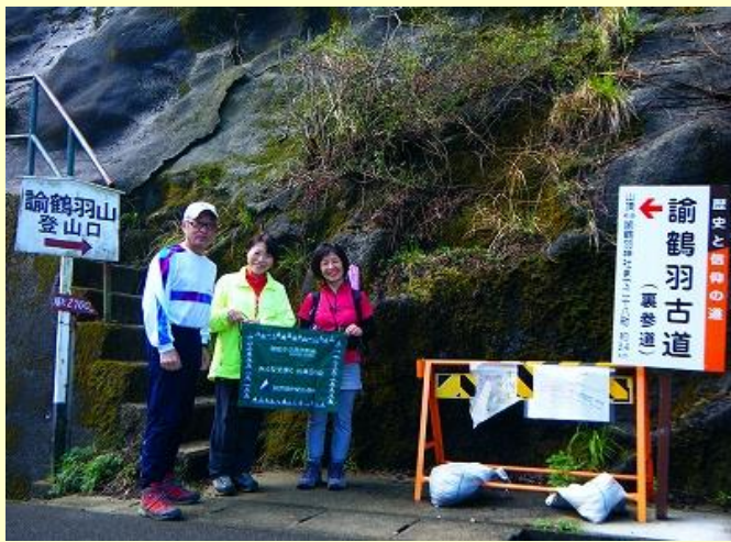
諭鶴羽山へはダムの横の階段を上がっていきます