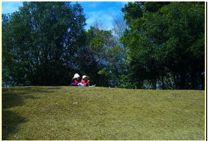
戦没者を慰霊する「山ボウシの広場」で昼食