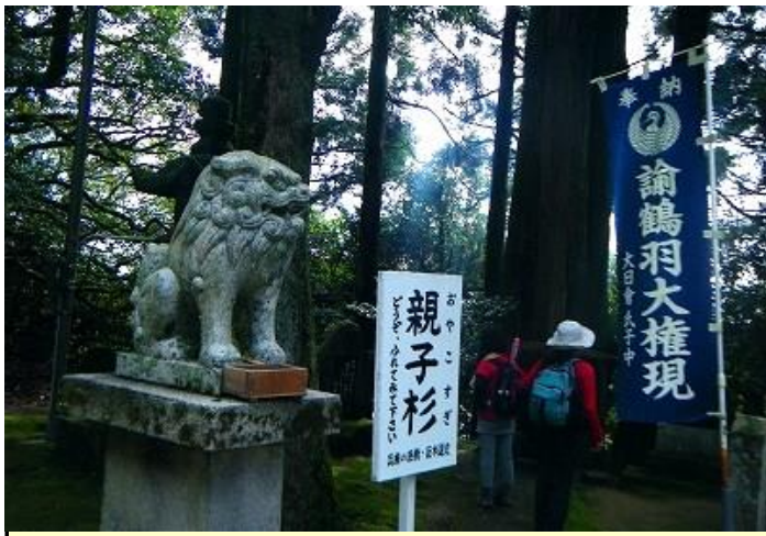
「親子杉」は兵庫の巨樹巨木に選定されてている