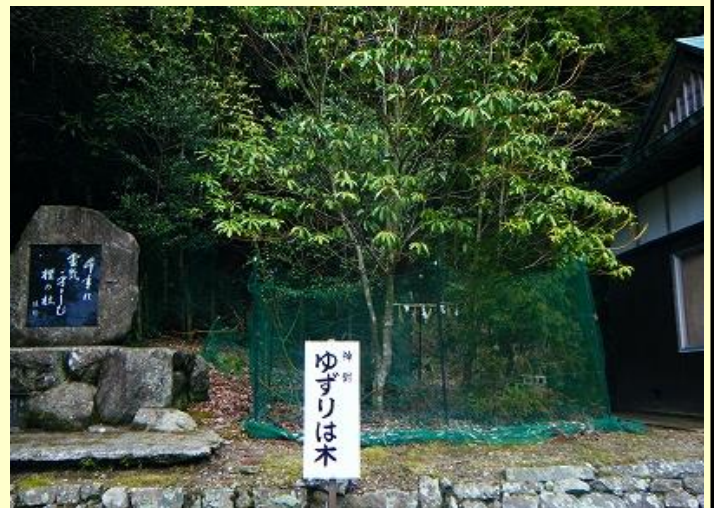
諭鶴羽山の名前の由来になったという「ゆずりは」の木