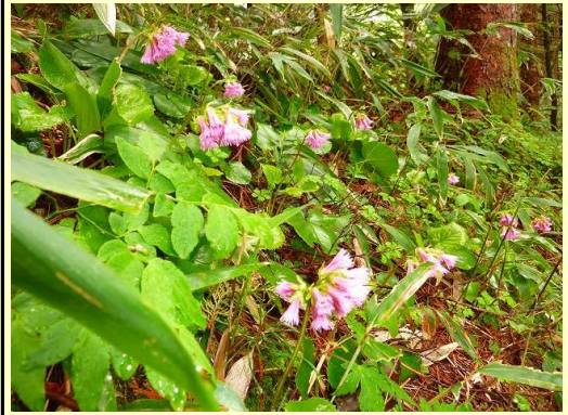
かわいい高山植物 コマクサ