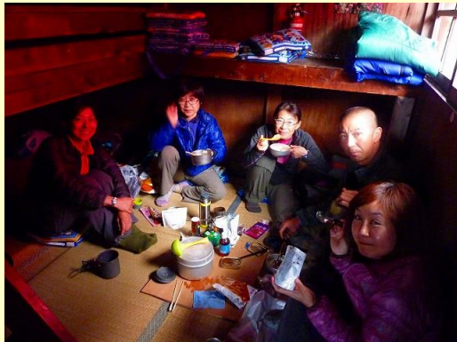
越百小屋の中はきれいにお掃除・整頓されてあり快適