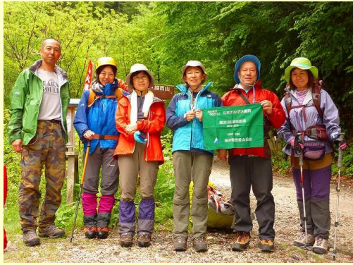
伊奈川ダム登山口から出発！