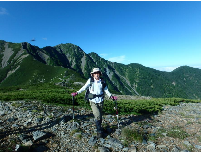
これから登る塩見岳