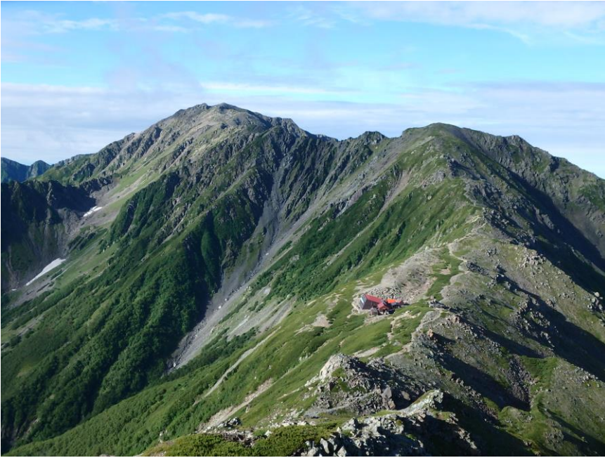
間ノ岳と北岳山荘