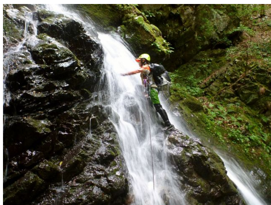
① 斜滝 7 m