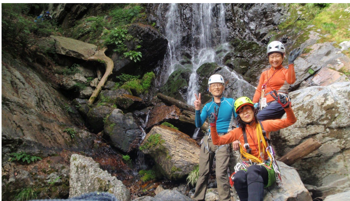
③ 15 m滝