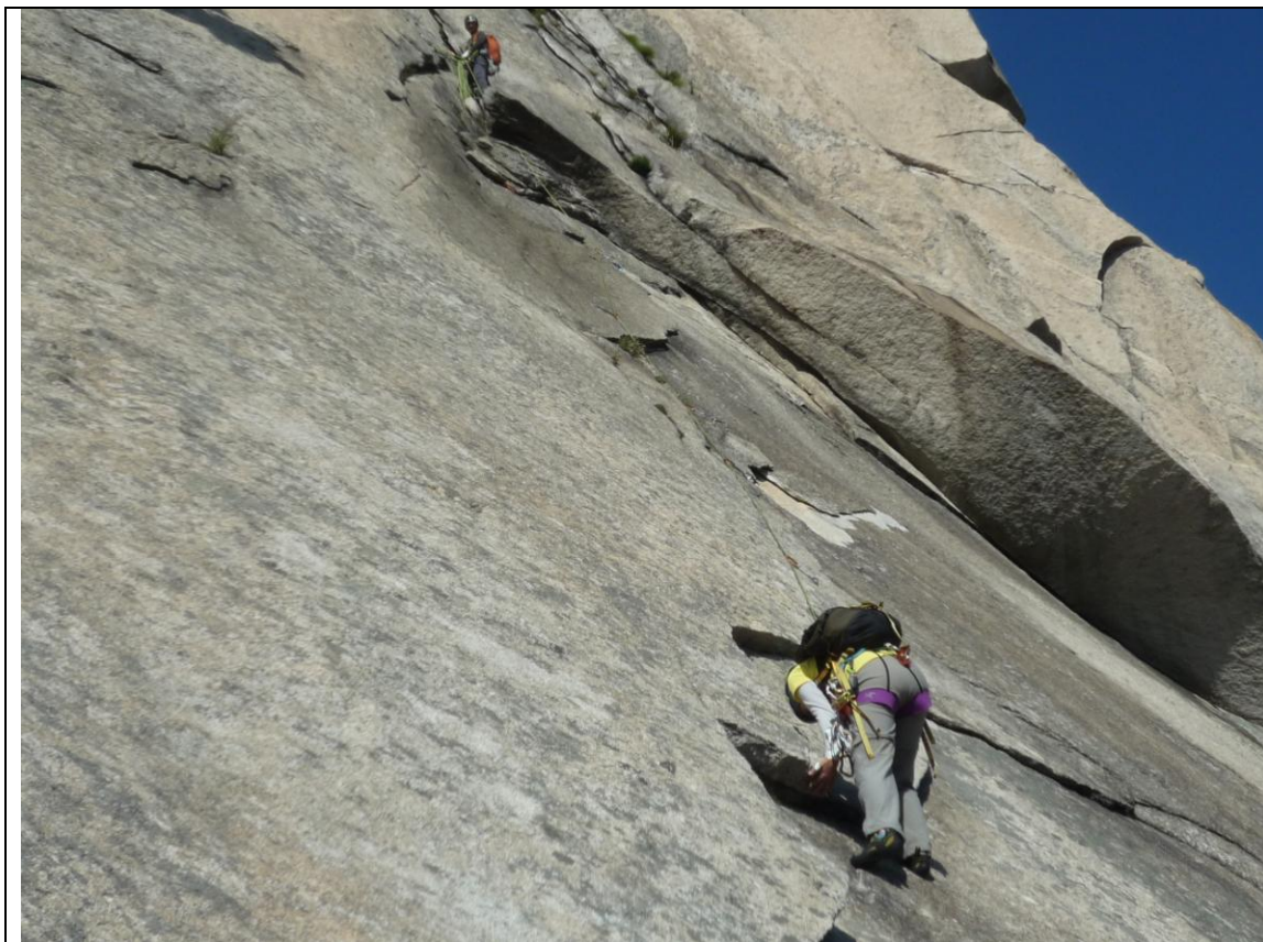
ショイナードB 2ピッチ目