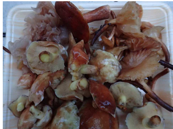
毒々しくも魅惑的な高級食材タマゴダケ 本日の収穫ハナビラタケ、コウジタケ等4種