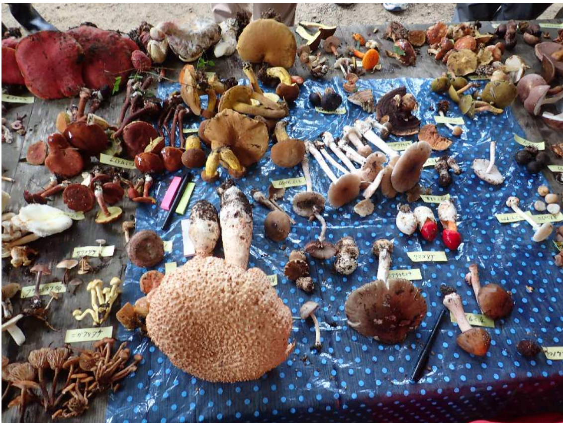
御影高校生とのキノコの同定（定点観察会にて）