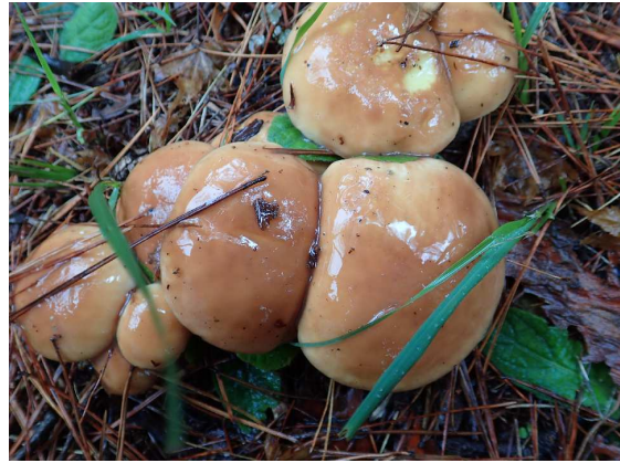
チチアワタケ（食用）