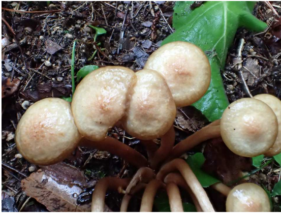
ナラタケモドキ（食用）