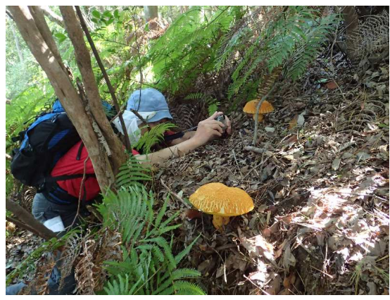
アカヤマドリタケ