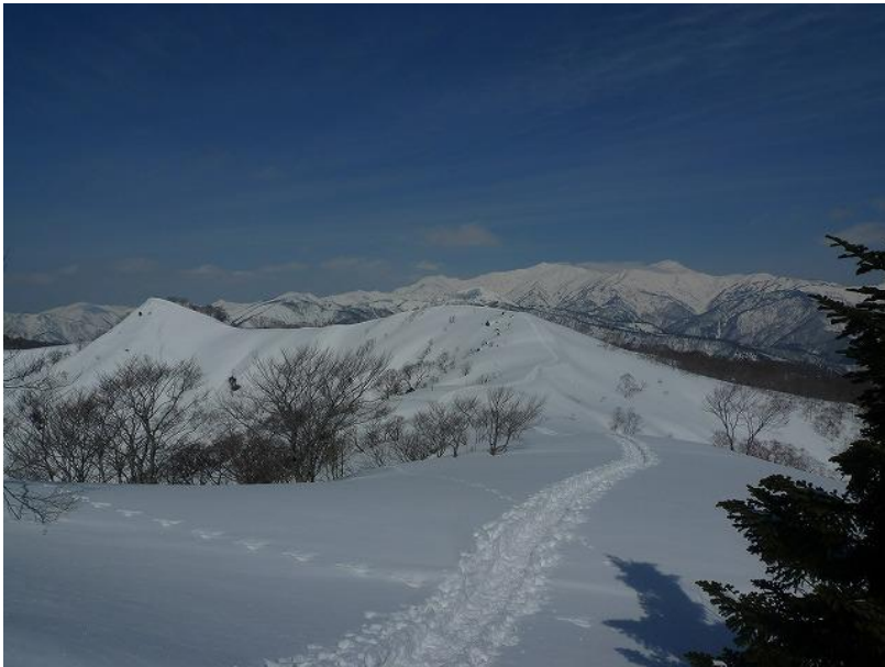
天狗山への雪稜 白山に近づきま す