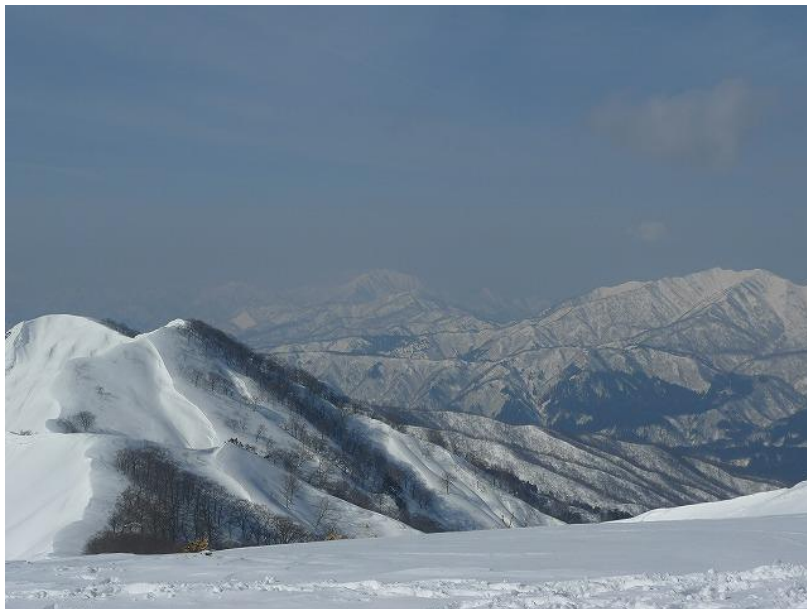
経ヶ岳の左に 荒島岳