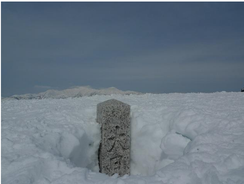
大日ヶ岳山頂 石標が掘り起 こされていた。