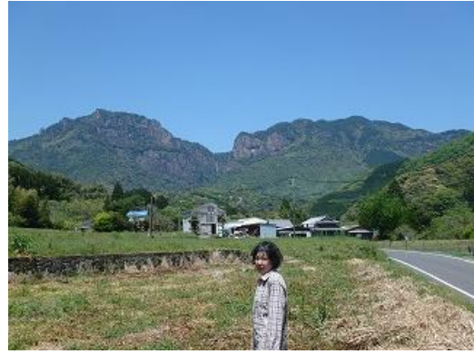
行藤山 左が雄岳、右が雌岳