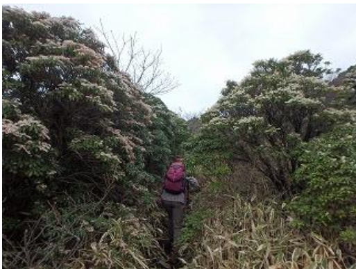
涌蓋山はアセビの花盛り