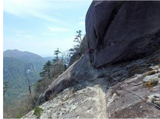
大崩山の下りの岩場