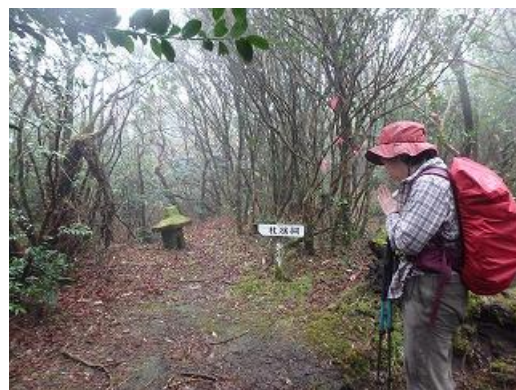
大籠柄岳の杖捨祠で山行の無事を祈る