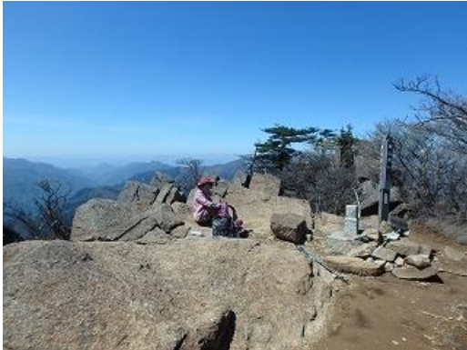
傾山頂上でほっと一息