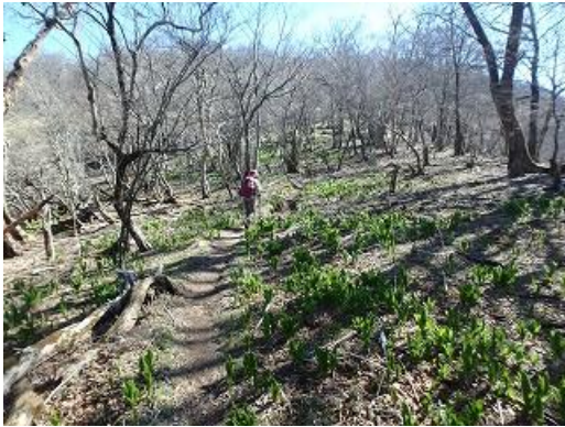
国見岳への道はコバイケイソウの葉が一杯