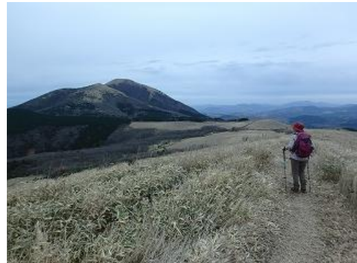
ミソコブシから涌蓋山に向かう