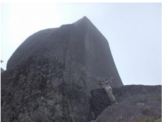
太忠岳の頂上、天柱石