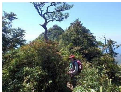
左側の三角がモッコヨム岳頂上