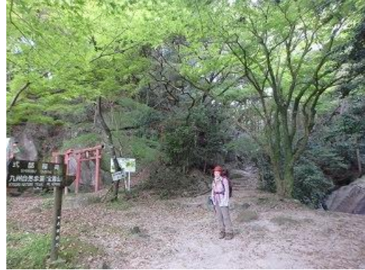
宝満山のもみじの新緑は美しい