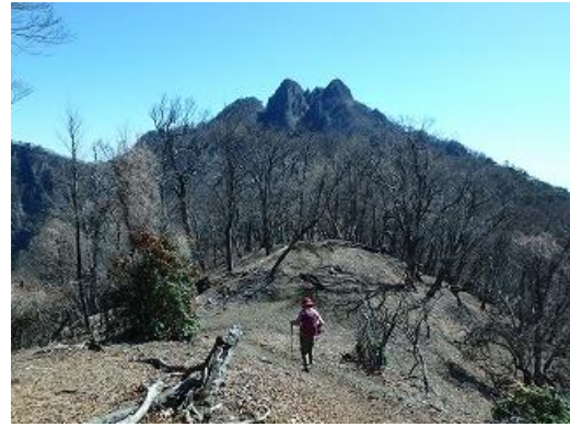
傾山頂上へ、しばらくはなだらかな道