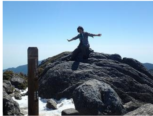
宮之浦岳の頂上は岩と雪