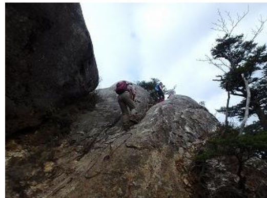
大崩山の登りの岩場