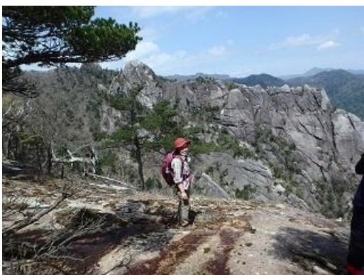
大崩山の小積ダキから湧塚コースを望む