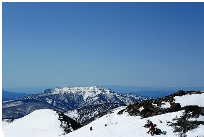
明日登る予定の武尊山。その向こうに富士山も