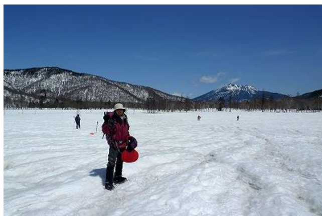
広大な尾瀬ヶ原。 小屋のある山の鼻はテント場になっています。