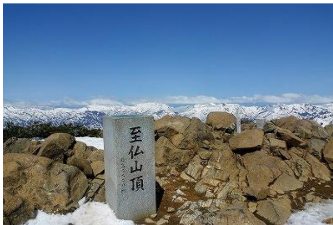
山頂からは大展望です。上越方面は真っ白