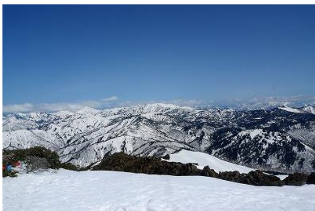
平ヶ岳方面（次は目標はあの山か・・・）