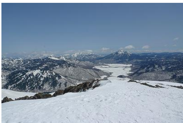
燧ヶ岳と尾瀬ヶ原を望みながら山の鼻へ下って行くコースは今の時期だけの限定コース