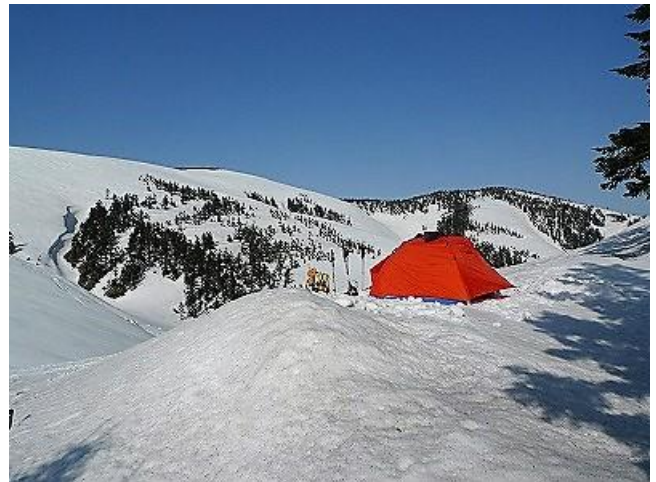
巻機山とニセ巻機山の鞍部にテント設営。 日帰り登山者もいなくなり静寂が訪れました。