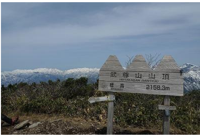
武尊山からも展望が広がります。 山頂付近は雪が有りません。