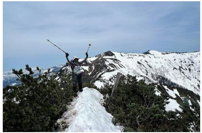
雪が少なくなったので剣ヶ峰も危険なところはありません。