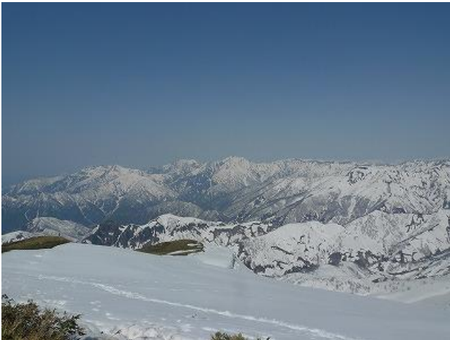
巻機山から少し足を延ばして牛ヶ岳へ 越後三山（八海山・越後駒ヶ岳・中岳）を望む絶景ポイントでした。