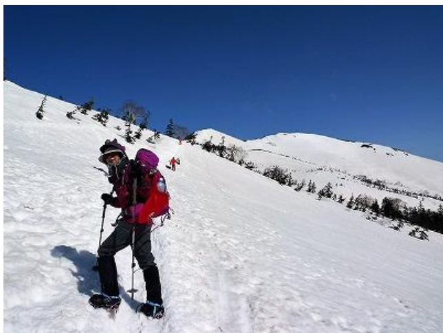
鳩待峠から景色を楽しみながら ゆっくりと至仏山へ