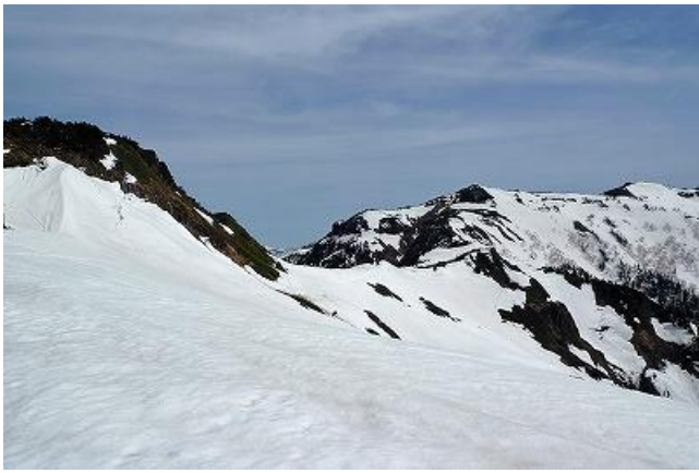
スキー場から武尊山へ 剣ヶ峰のトラバースルートは回避して尾根上へ