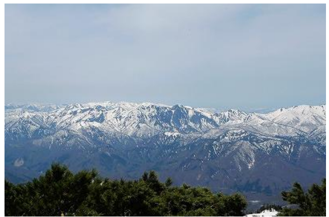
谷川岳から平標山方面