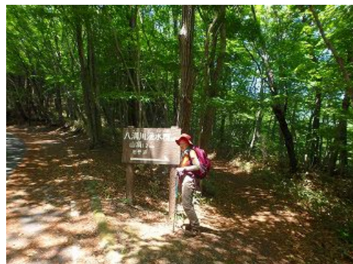
八溝山で飲んだ金性水は美味しかった