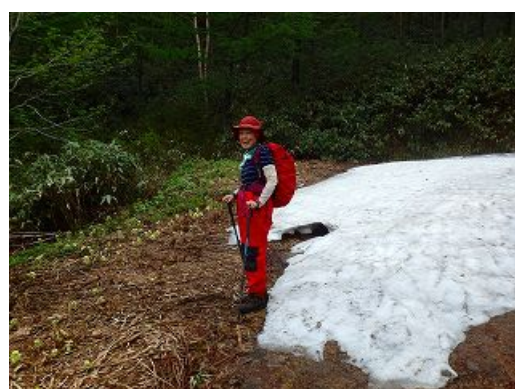
雪解けの所にはフキノトウの芽が出ている