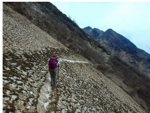
那須岳避難小屋から朝日岳へ雪渓を歩く