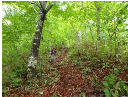
二岐山・女岳からの地獄坂は急な下り