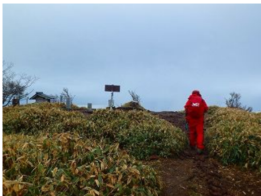
前方、釈迦ヶ岳の頂上に小さな祠が在る