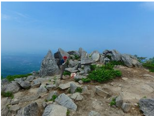
姫神山頂上、ここにも祠があった