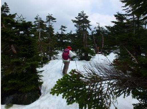
八幡平は雪の中、青森とど松が頑張ってる。右は鏡沼、わずかな期間だけ見れる姿だそうだ