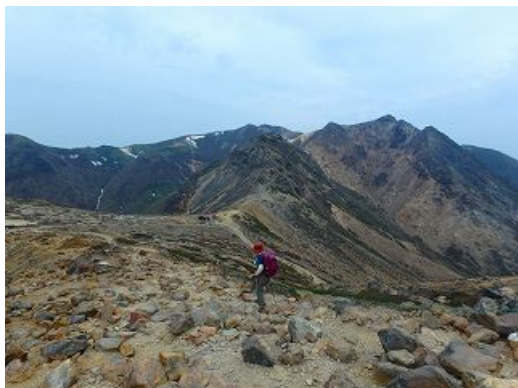
那須岳・茶臼岳から三本槍岳方面を見る