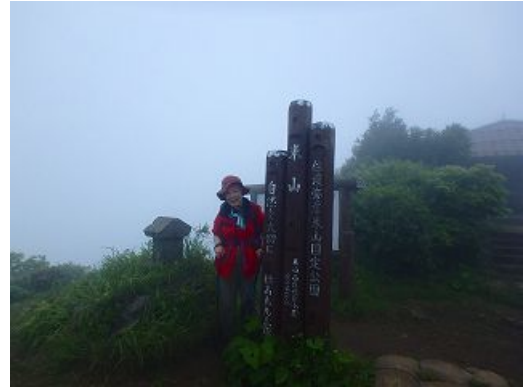
日本三大薬師の米山薬師堂がある山頂