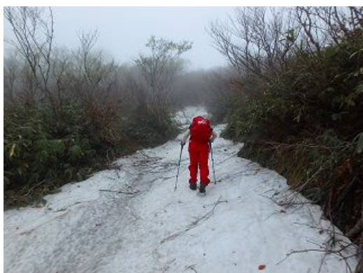
七ヶ岳、この時期あまり人は入っていない。