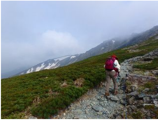
早池峰山は強風で飛ばされそうだった。