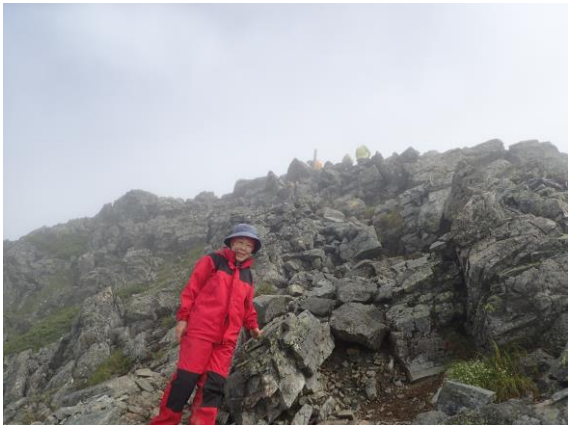
真ん中上が水晶岳頂上、水晶は見当たらず