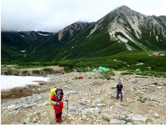
三俣蓮華岳への登り道から鷲羽岳