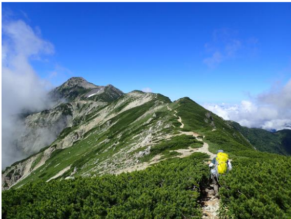
笠ヶ岳の頂上まであと少し