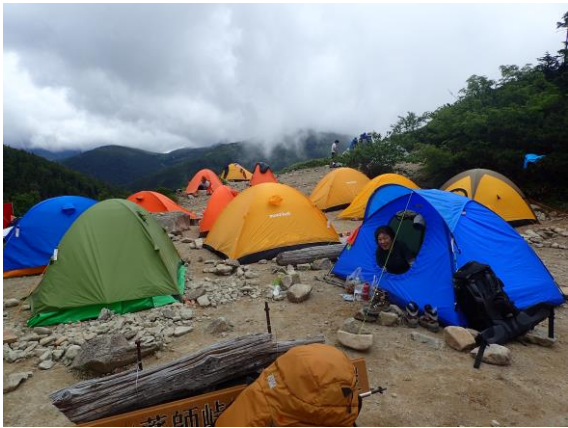
薬師峠キャンプ場、水場とトイレが近くて快適