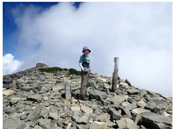
笠ヶ岳頂上は私達だけ