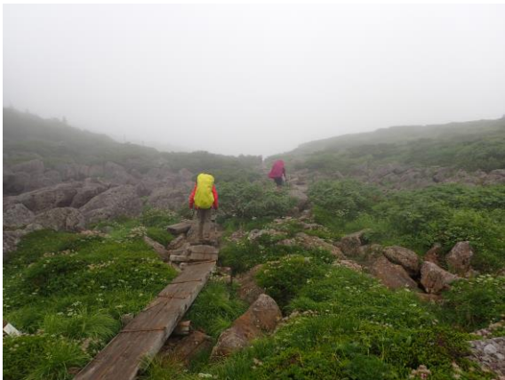
あこがれの雲ノ平。木道の散歩道