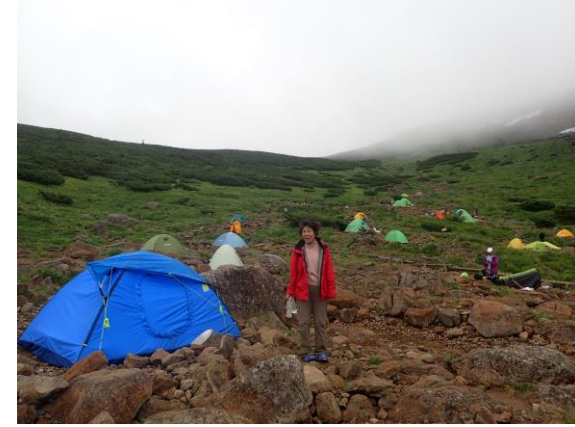
雲ノ平キャンプ場。ガレ地の中にテントが散在