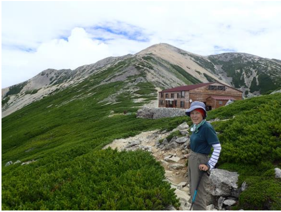
薬師岳山荘を経て、左の奥が薬師岳頂上