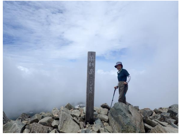
薬師岳頂上、岩がゴロゴロ、祠がある