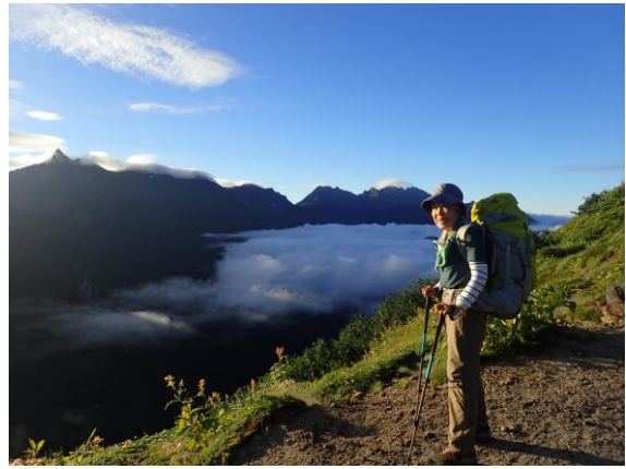
笠ヶ岳への稜線から槍ヶ岳と穂高