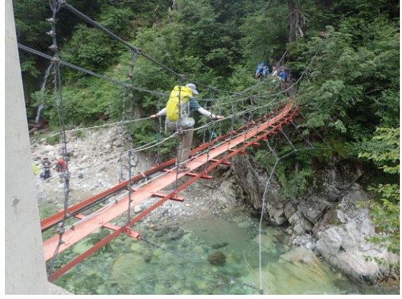
薬師沢出合から雲ノ平へ。吊り橋は一人ずつ