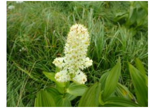
コバイケイソウの花に ようやく出会う