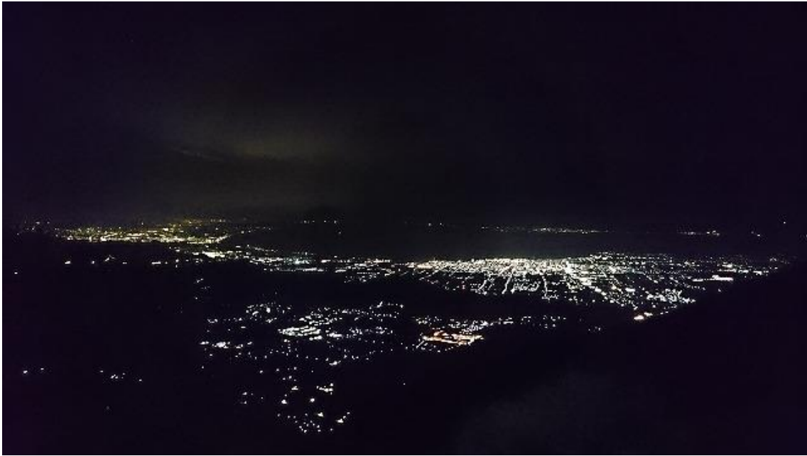
長浜、彦根、そして琵琶湖対岸の夜景が綺麗です