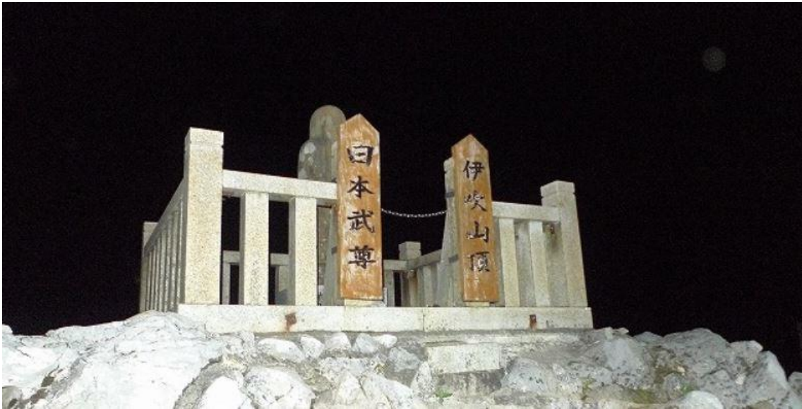
山頂ですが、ここは一等三角点ではありません。