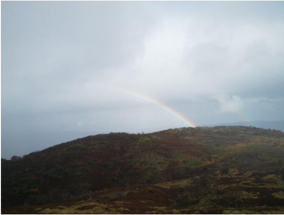
藤原岳山頂から見た、虹。