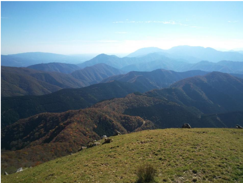
霊仙山頂からこれから向かう鈴鹿山脈の山々を望む。