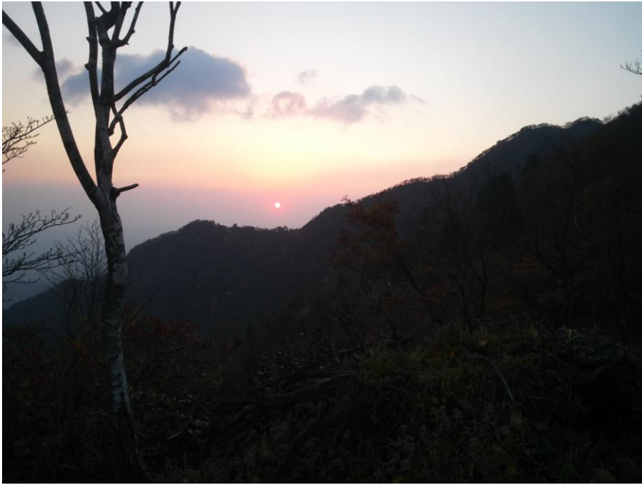
三池岳から見た、日の出。