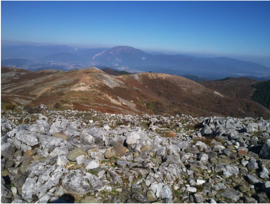
霊仙山頂から伊吹山方面を望む。